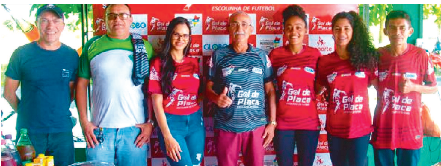
O GOL DE PLACA NASCEU EM 2018 PARA ATENDER CRIANÇAS E ADOLESCENTES EM SITUAÇÃO DE VULNERABILIDADE SOCIAL

A Escolinha Gol de Placa, iniciativa patrocinada pelo governo do Estado do Maranhão e pelas Drogarias Globo, por meio da Lei Estadual de Incentivo ao Esporte, teve sua terceira edição lançada oficialmente, em solenidade na Associação Atlético Boa Vida, no bairro Areal, em Bacabal.