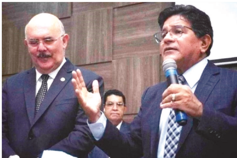
A INSTALAÇÃO DA COMISSÃO AGORA DEPENDE DO PRESIDENTE DO SENADO

Sobre a pressão da base governista para a abertura de outras CPIs, Ran-