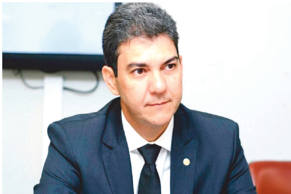
BRAIDE ANUNCIOU APOIO À PRÉ-CANDIDATURA DE WEVERTON AO GOVERNO DO ESTADO

Eduardo Braide afirmou que a sua decisão tem muito haver com o atual momento econômico pelo qual passa o Brasil, e que o Maranhão precisa de um governador que tenha trânsito e diálogo com os diferentes campos políticos em Brasília. “O país está passando por uma crise econômica, uma crise de alta de combustíveis, sérios problemas que a gente tem acompanhado em Brasília e eu entendo que o Maranhão precisa de um governador que tenha capacidade de dialogar com todas as forças políticas de Brasília para que possa ajudar o Estado. E o senador Weverton Rocha demonstrou essa capacidade de dialogar com todas as forças políticas de Brasília. Mais além disso, eu sempre disse que São Luís precisa de governantes que ajudem a cidade, que ajudem a administração no Município. O senador Weverton Rocha, desde o ano passado, tem ajudado o Município de São Luís, destinando recursos para área da saúde e outras aéreas. Então, por conta disso, o meu candidato a governador nesse ano, nessas eleições, será o senador Weverton Rocha”, afirmou