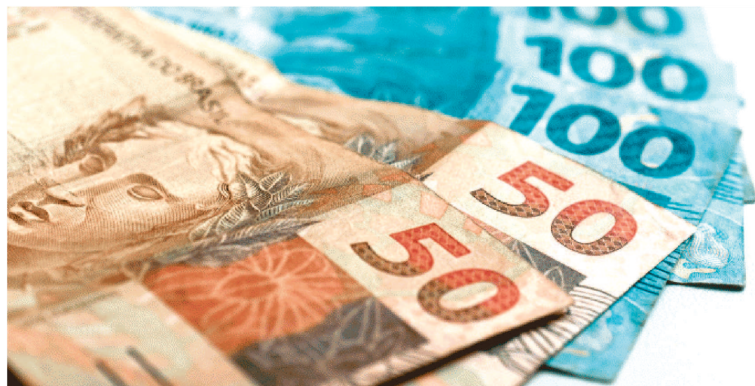
O RECOLHIMENTO NO ANO ATINGIU A MARCA DE R$ 908,551 BILHÕES, UM CRESCIMENTO DE 9,75%

A arrecadação de impostos e contribuições federais somou R$ 165,333 bilhões em maio, de acordo com a Receita Federal. O montante representa um aumento real de 4,13% em relação ao mesmo mês do ano anterior, já descontada a inflação do período.