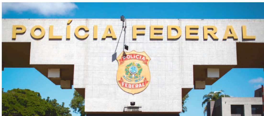
INVESTIGAÇÃO FOI INSTAURADA APÓS “POSSÍVEL INTERFERÊNCIA NA OPERAÇÃO ACESSO PAGO”

A Polícia Federal (PF) afirmou nesta quinta-feira (23/6) que determinou a instauração de um “procedimento apuratório” para investigar suposta interferência na Operação Acesso Pago, que resultou na prisão preventiva do ex-ministro da Educação Milton Ribeiro — solto hoje após habeas corpus de sua defesa.