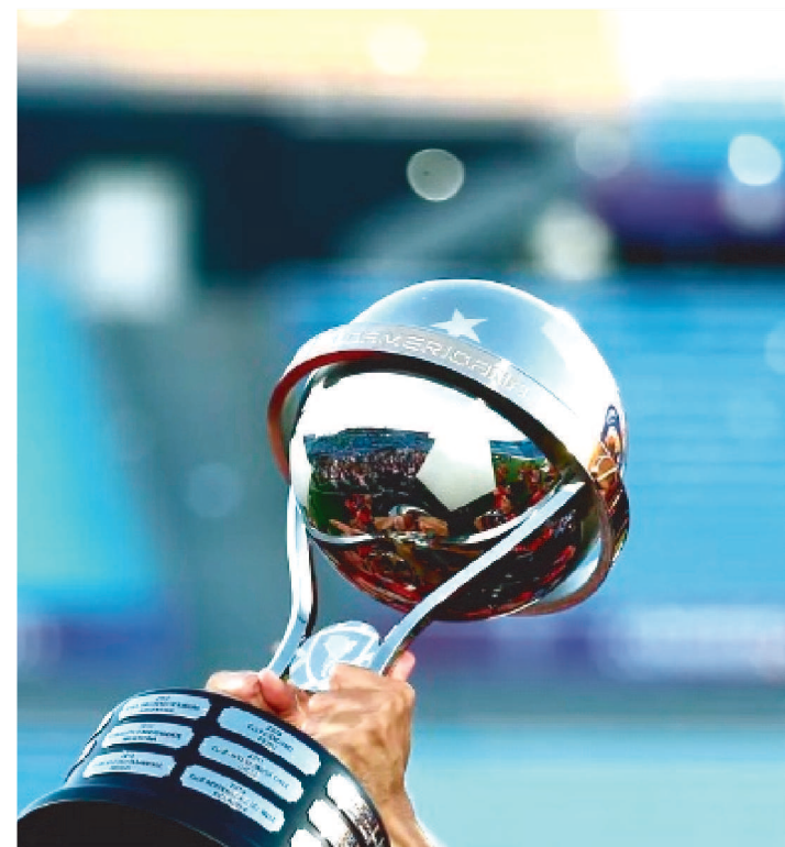
O JOGO SERÁ EM UM SÁBADO E AS ELEIÇÕES NO DOMINGO

A final da Copa Sul-Americana, marcada para o dia 1º de outubro, deve ser retirada de Brasília. O Conselho da Conmebol vai se reunir no dia 7 de julho em Cáli, na Colômbia, para decidir onde será o jogo.