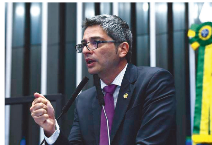
PORTINHO FALA EM INSENSIBILIDADE DE GOVERNADORES

Em entrevista coletiva convocada nesta quinta-feira (23), no Senado Federal, o líder do governo, senador Carlos Portinho (PL-RJ) afirmou que a Proposta de Emenda Constitucional dos Combustíveis (PEC 16/2022) deve focar em projetos sociais, como um voucher de R$ 1000 para caminhoneiros, aumento do vale-gás — já anunciados ao longo da semana — e também para aumentar o Auxílio Brasil.