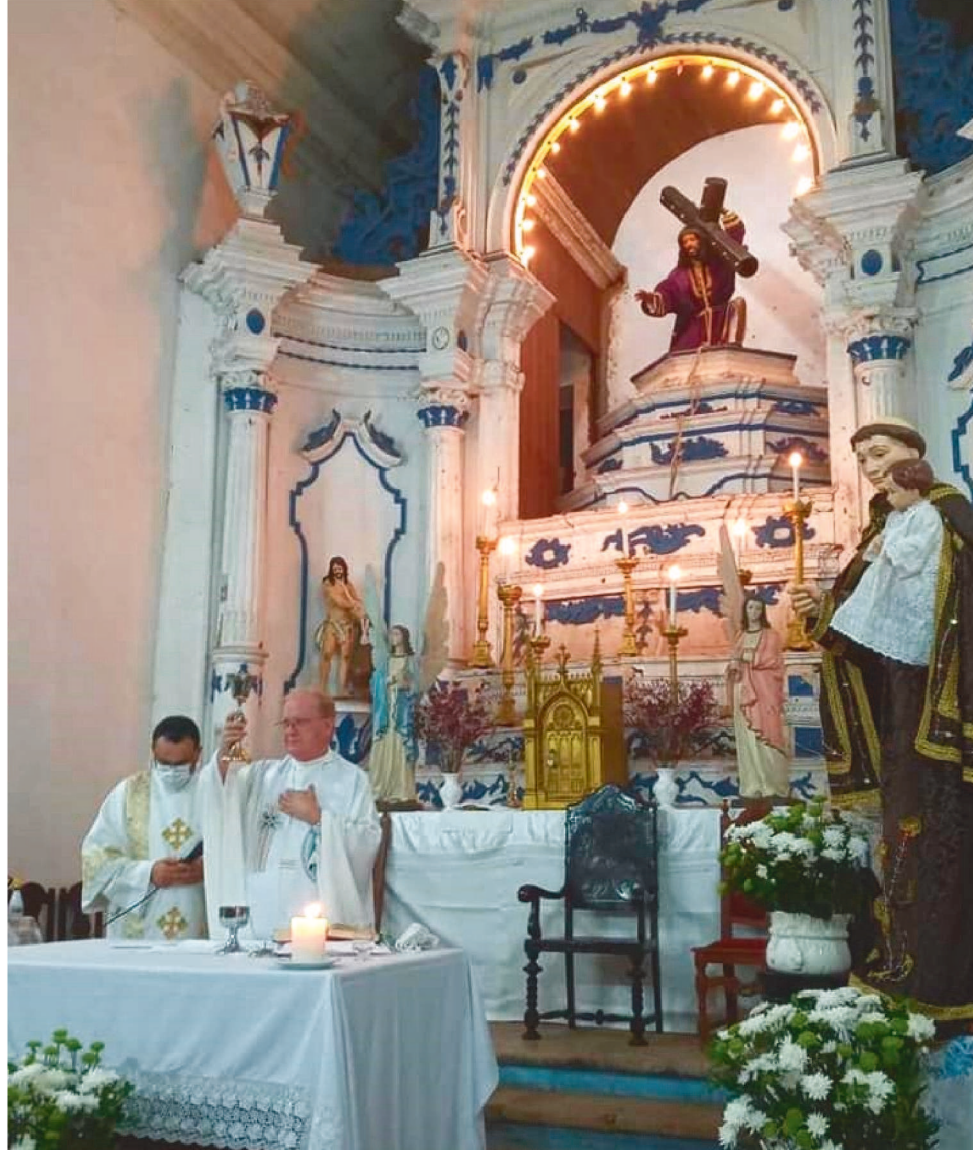
DE 1º A 12 DE JUNHO A PROGRAMAÇÃO INICIA LOGO CEDO ÀS 6H30 COM A SANTA MISSA

No dia 13, dia de Santo Antônio, haverá missa de hora em hora, bênção e distribuição de pães.