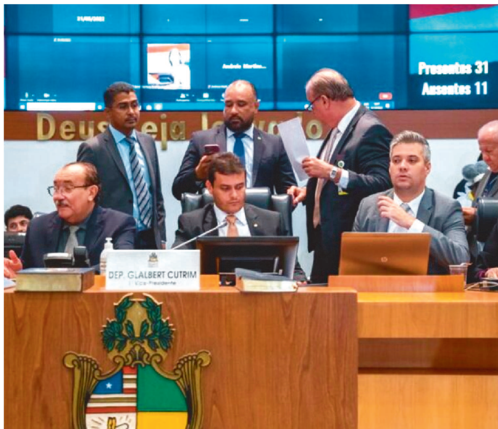
DEPUTADO GLALBERTH CUTRIM, CONDUZIU A SESSÃO PLENÁRIA DESTA TERÇA

Vice de Weverton – Em meio a todos esses acontecimentos políticos, o deputado estadual Hélio Soares (PL),