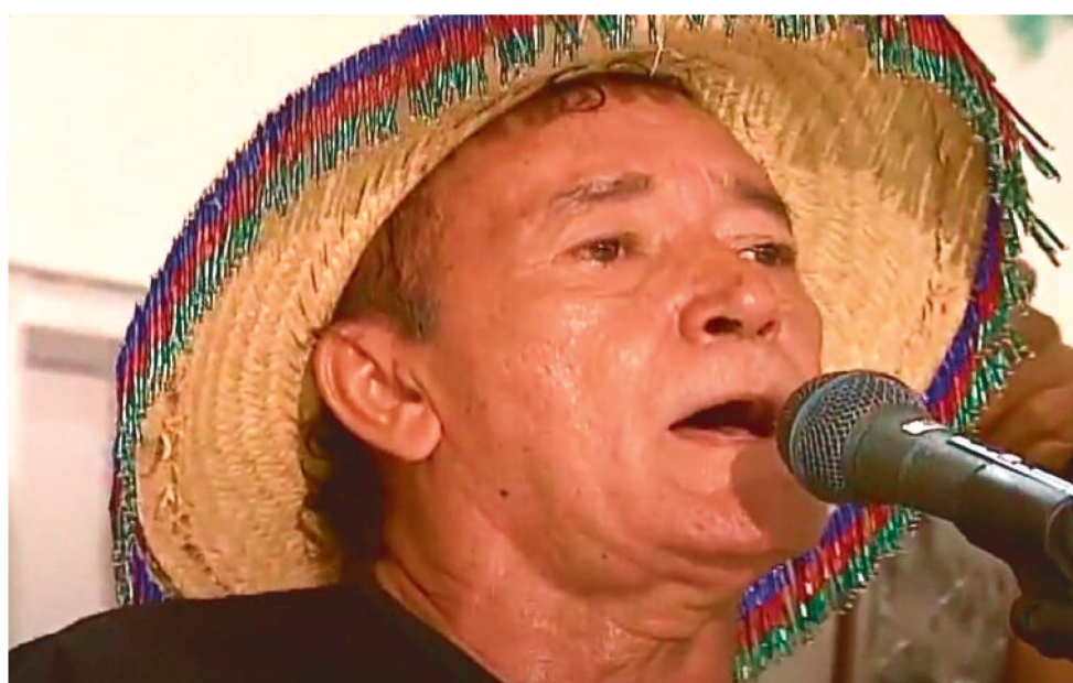
A MÚSICA “BOI DE LÁGRIMAS” É CONSIDERADA UMA ESPÉCIE DE HINO DOS FESTEJOS