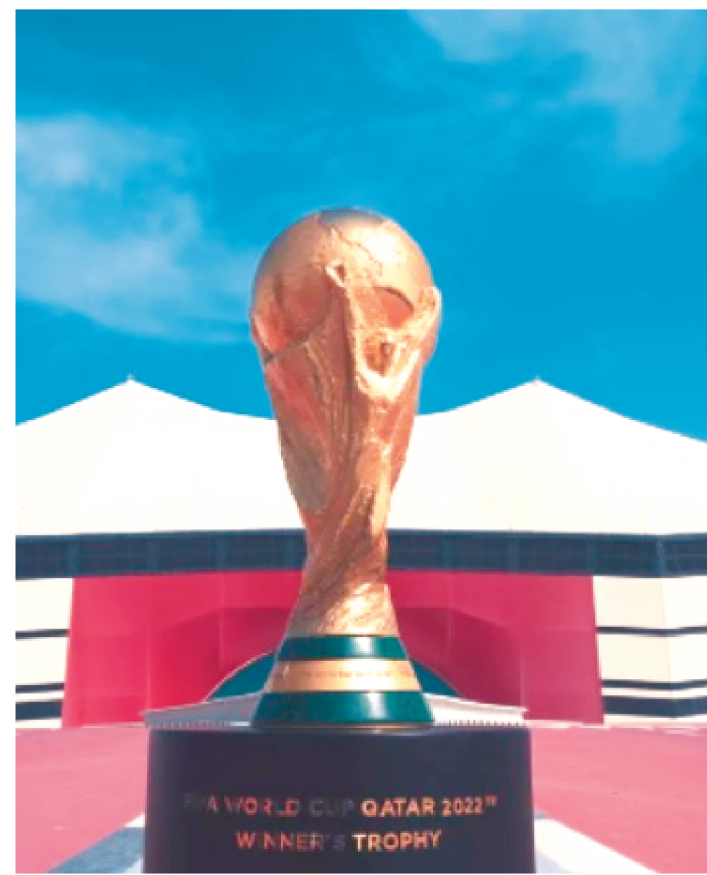
AUMENTO DE INSCRITOS FOI UM PEDIDO DOS TREINADORES

A reunião anual da International Board (IFAB, na sigla em inglês), órgão que regula as regras do futebol, deve oficializar a mudança para permitir que cada seleção leve 26 atletas para a Copa do Mundo do Catar, em vez dos habituais 23.