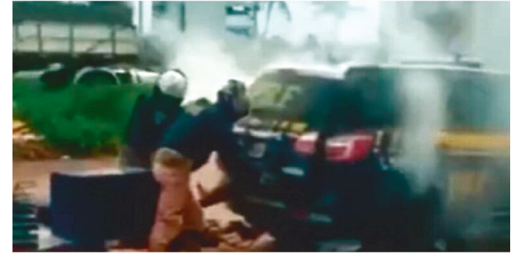
PROCEDIMENTO APURA CONDUTA DOS POLICIAIS ENVOLVIDOS