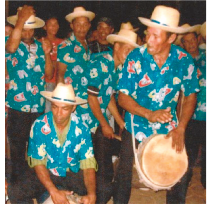
A APRESENTAÇÃO ACONTECE AMANHÃ, ÀS 19H, NO CCVM

O Centro Cultural Vale Maranhão dá início à sua programação de São João recebendo o Tambor de Crioula de São Benedito de Mato Grosso.