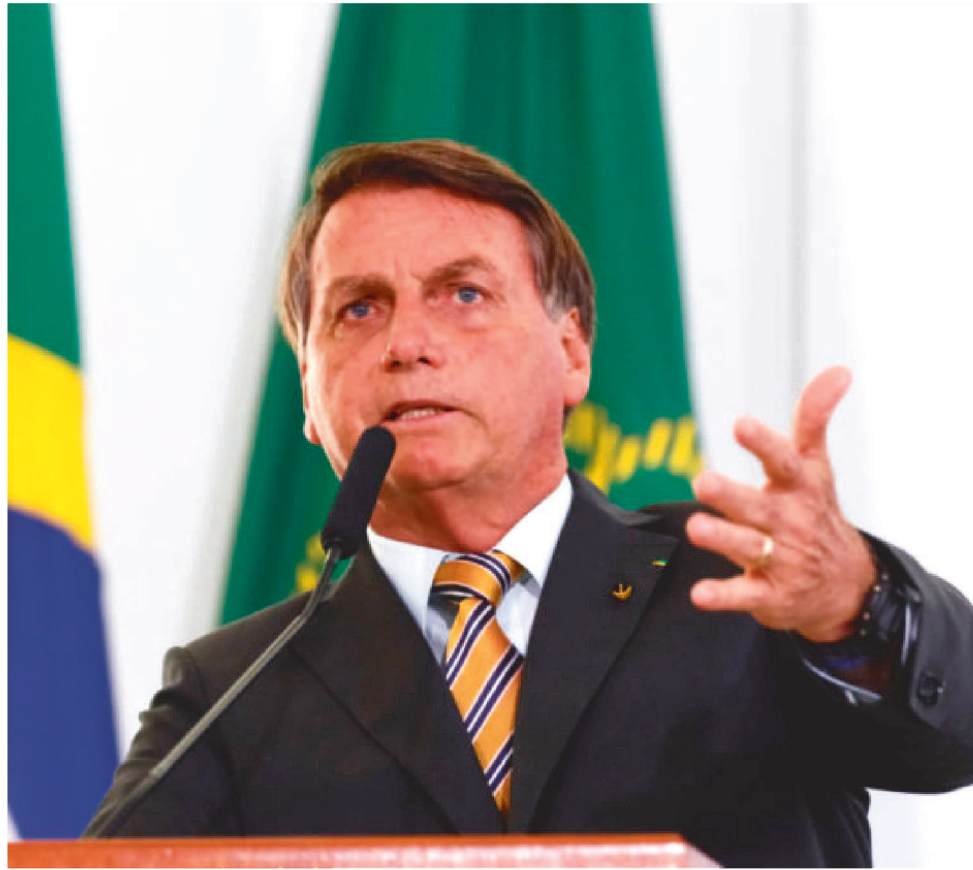
PRESIDENTE CRITICOU POSSIBILIDADE DE AUMENTO DO VALOR DO ICMS SOBRE O DIESEL

"A privatização da Petrobras leva no mínimo quatro anos. Tenho uma ideia de fatiar a Petrobras. Realmente não está dando certo atualmente", declarou o presidente.