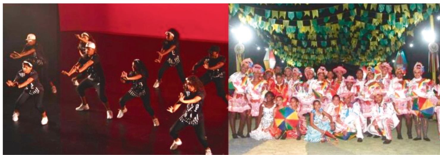
O GRUPO É O ÚNICO DO MARANHÃO NO FESTIVAL DE DANÇA DE JOINVILLE E BUSCA PATROCÍNIO PARA PARTICIPAR DO EVENTO