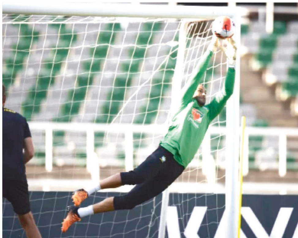
EDERSON SE MACHUCOU E O GOLEIRO WEVERTON SERÁ O TITULAR NO AMISTOSO

Assim, o Brasil irá a campo nesta quinta-feira com: Weverton, Daniel Alves, Marquinhos, Thiago Silva e Alex Sandro; Casemiro e Fred; Raphinha, Richarlison, Lucas Paquetá e Philippe