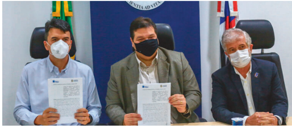
PARCERIA VISA FORTALECER OS PRINCÍPIOS DO PACTO GLOBAL DAS NAÇÕES UNIDAS

De acordo com o documento, a parceria entre a EMAP e a UEMA visa