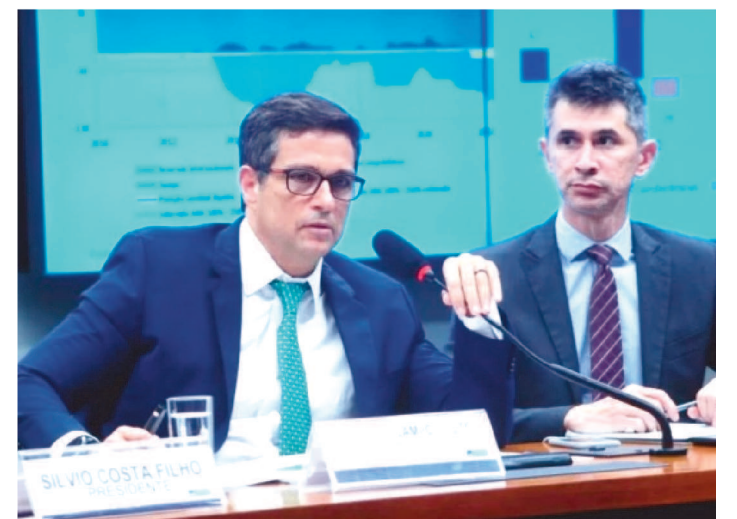
CELULARES ROUBADOS VIRAM ALVOS COM APPS BANCÁRIOS

O presidente do Banco Central, Roberto Campos Neto, afirmou que a autoridade monetária vai iniciar um processo de responsabilização de bancos caso haja fraudes envolvendo o Pix. Isso porque tem crescido o número de casos em que ladrões roubam os celulares de vítimas com o intuito de acessar os aplicativos bancários para transferir indevidamente o dinheiro para outras contas.