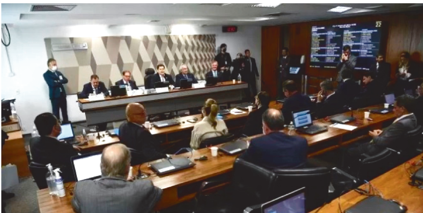
A PROPOSTA TRANSFORMA INEP, IBGE, IPEA, CNPQ E CAPES EM POLÍTICAS DE ESTADO. O TEXTO SEGUIRÁ PARA ANÁLISE EM PLENÁRIO

A Comissão de Cidadania e Justiça do Senado Federal aprovou nesta quarta-feira (1º/6), a PEC 27/2021, que define que instituições, como o Instituto Nacional de Estudos e Pesquisas Educacionais Anísio Teixeira (Inep), Instituto de Pesquisa Econômica Aplicada (Ipea) e Instituto Brasileiro de Geografia e Estatística (IBGE), se tornem permanentes de Estado. O texto seguirá para análise em plenário.