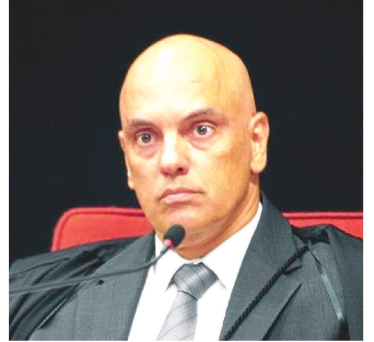
MINISTRO SERÁ PRESIDENTE DO TSE, SUBSTITUINDO FACHIN

O ministro do Supremo Tribunal Federal (STF), Alexandre de Moraes, foi reconduzido a mais dois anos como membro do Tribunal Superior Eleitoral (TSE). Moraes completa o primeiro biênio nesta quinta-feira (2/6), quando terminaria seu mandato.