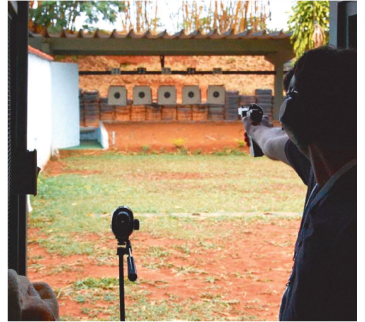
PL SEGUE PARA SANÇÃO DO GOVERNADOR DO MARANHÃO

Foi aprovado, na Assembleia Legislativa do Maranhão, um projeto de lei que prevê o reconhecimento do risco da atividade e a necessidade do porte de armas de fogo ao atirador desportivo no Maranhão.