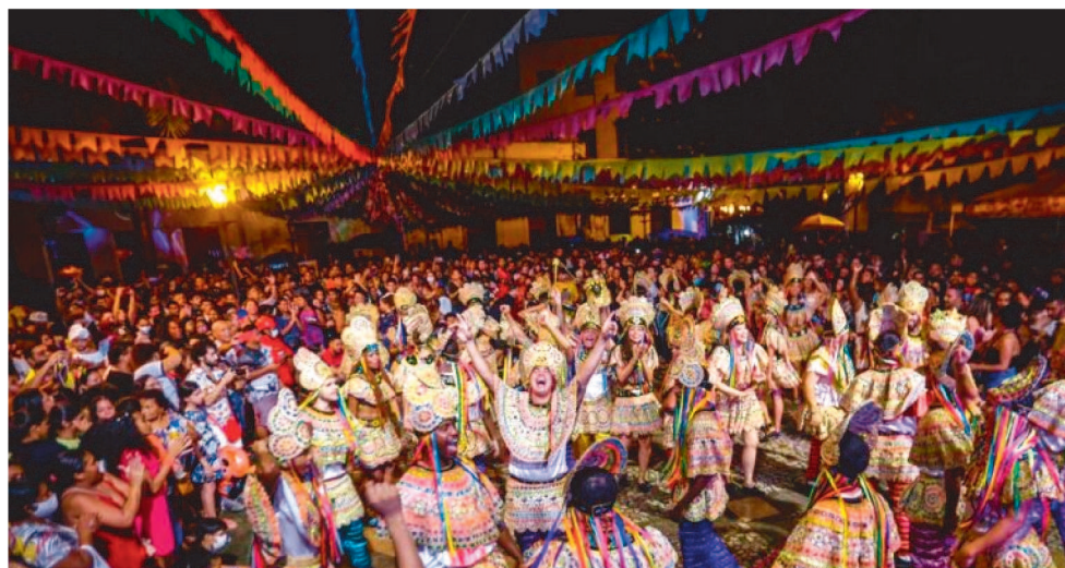
OS FESTEJOS JUNINOS VÃO ATÉ 31 DE JULHO, EM ARRAIAIS EM TODA A CIDADE

No Ceprama, a programação será de 2 a 5 de junho, e depois de 9 a 12 de junho, iniciando sempre às 19h. No dia 2, o arraial começa com o Tambor de Crioula União da Baixada, em seguida, Cacuriá da Basson, Boi Upaon Açú (sotaque de orquestra), show de