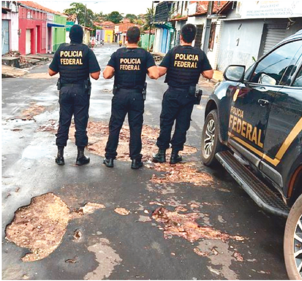
FORAM IDENTIFICADOS SERVIDORES DO INSS SUSPEITOS DE PARTICIPAR DO ESQUEMA

Os dois servidores da autarquia previdenciária, receberam, além dos mandados de prisão preventiva, uma determinação de suspensão do exer-