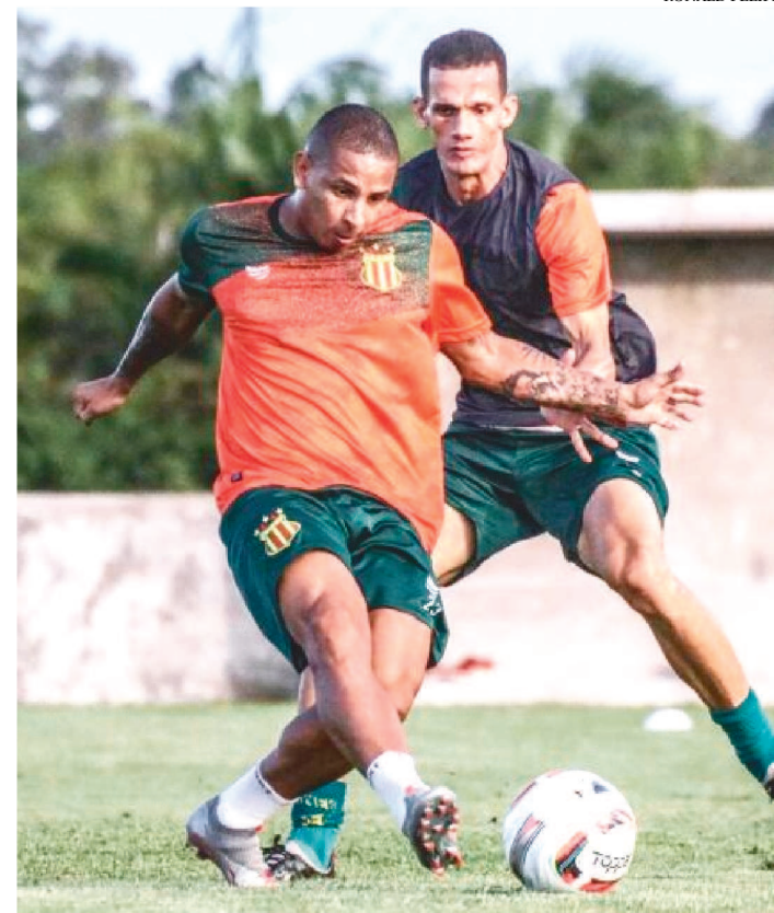
SAMPAIO VAI BUSCAR MAIS UMA VITÓRIA NA SÉRIE B DE 2022

Neste sábado, o Sampaio Corrêa tem confronto fora de casa diante do Novorizontino, válido pela 10ª rodada da competição.