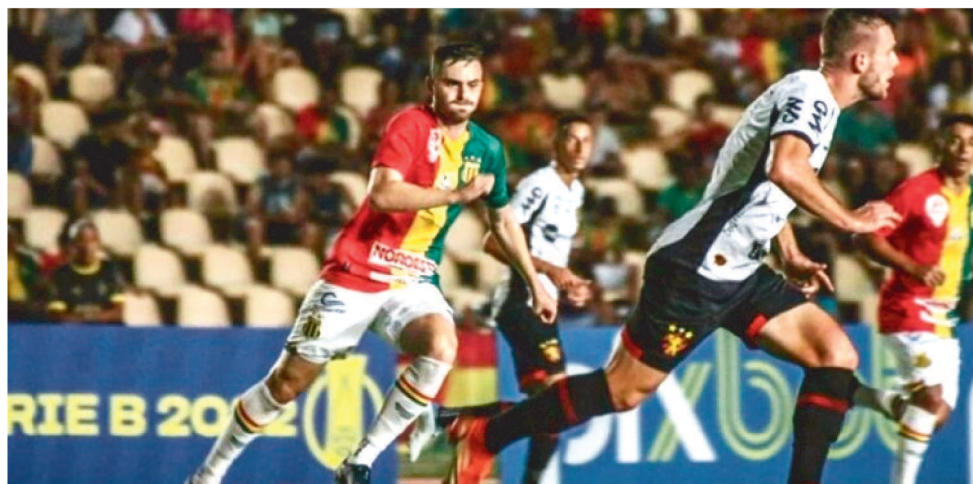
O SAMPAIO CORRÊA VEM DE BONS RESULTADOS DENTRO DO ESTÁDIO CASTELÃO

O Sampaio disputou 22 jogos, conquistou 29 pontos, obteve 8 vitórias, 5 empates, 9 derrotas, marcou 26 gols e sofreu 25, tem 1 gol de saldo positivo. Por sua vez, o Bahia também jogou 22