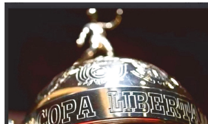
ATHLETICO-PR, FLAMENGO E PALMEIRAS NA LIBERTADORES

Conhecidos os confrontos das semifinais da Libertadores, a Conmebol já divulgou as datas e horários dos confrontos derradeiros que definirão os dois finalistas da edição de 2022 do principal torneio da América do Sul.