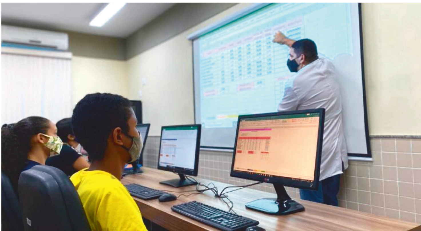
AO TODO, SERÃO DISPONIBILIZADOS 67 CURSOS, SENDO 19 TÉCNICOS E 48 DE QUALIFICAÇÃO, COM CARGAS HORÁRIAS DE 160H A 1800H

Nesta segunda-feira, 15, o Senac-MA lança a ampliação da oferta de cursos com recurso do Programa Senac de Gratuidade (PSG), a partir das 17h, no Restaurante Escola Senac, localizado no Centro Histórico. O evento contará com a presença de autoridades, gestores da Federação do Comércio de Bens, Serviços e Turismo do Estado do Maranhão (Fecomércio), do Sesc e do Senac, além de representantes de outras entidades e líderes comunitários.