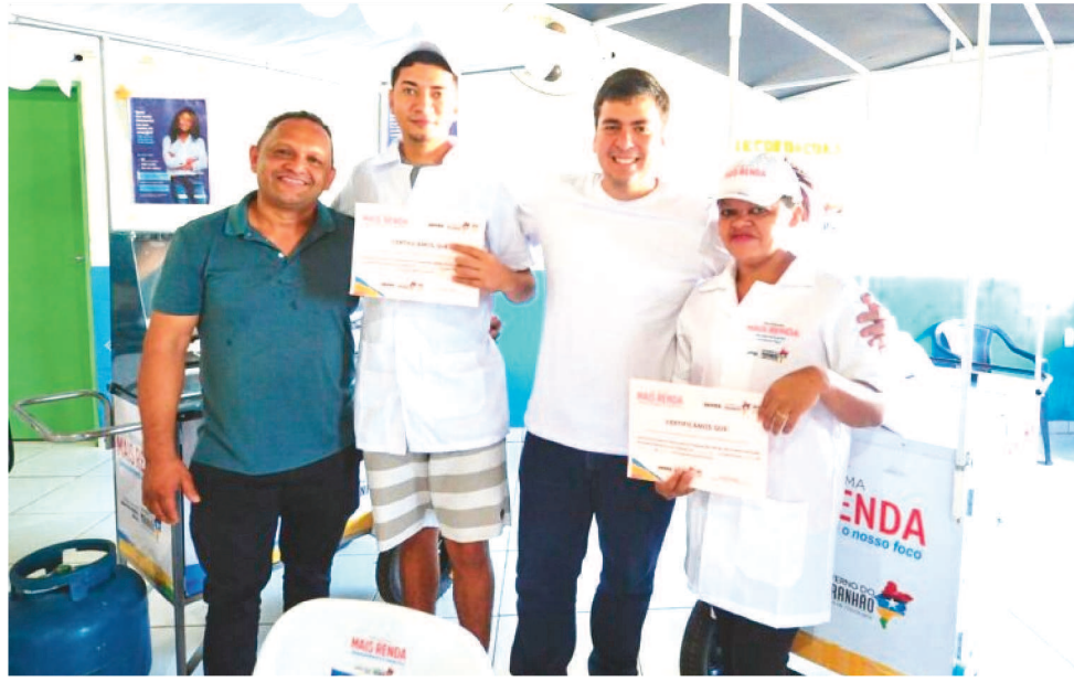
CANTANHEDE, LIMA CAMPOS E ALTO ALEGRE FORAM OS MUNICÍPIOS CONTEMPLADOS