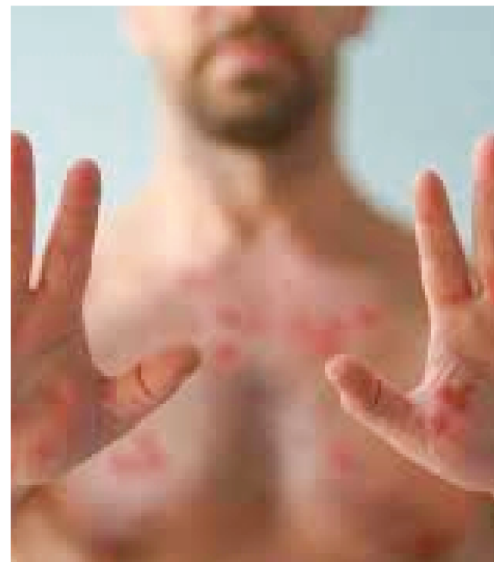
DOENÇA FOI IDENTIFICADA EM UM HOMEM DE SÃO LUÍS

O Maranhão confirmou o segundo caso de Monkeypox, conhecida como varíola dos macacos, na noite desta sexta-feira (12). Segundo a Secretaria de Estado da Saúde (SES), trata-se de um homem de 38 anos que mora em São Luís.