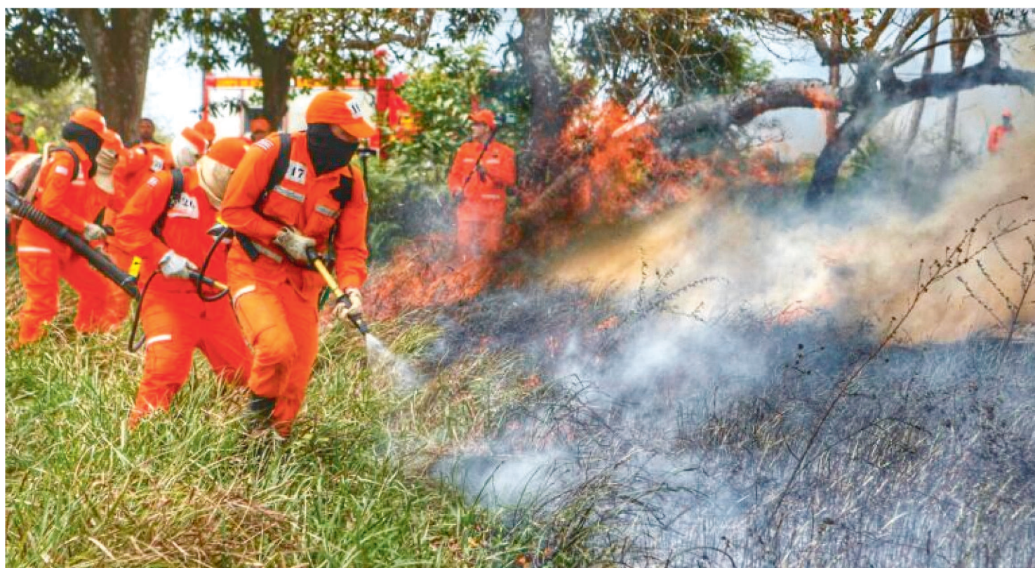
EFETIVO DO CORPO DE BOMBEIROS RECEBEU CAPACITAÇÃO PARA COMBATER INCÊNDIOS EM ÁREAS DE VEGETAÇÃO

Parte do efetivo do Corpo de Bombeiros Militar do Maranhão (CBMMA) participou, nesta sexta-feira (12), da aula de Instrução de Nivelamento de Conhecimento (INC Florestal), no Centro de Formação e Aperfeiçoamento de Praças, da Polícia Militar do Maranhão (PMMA), no bairro Tibiri, em São Luís.