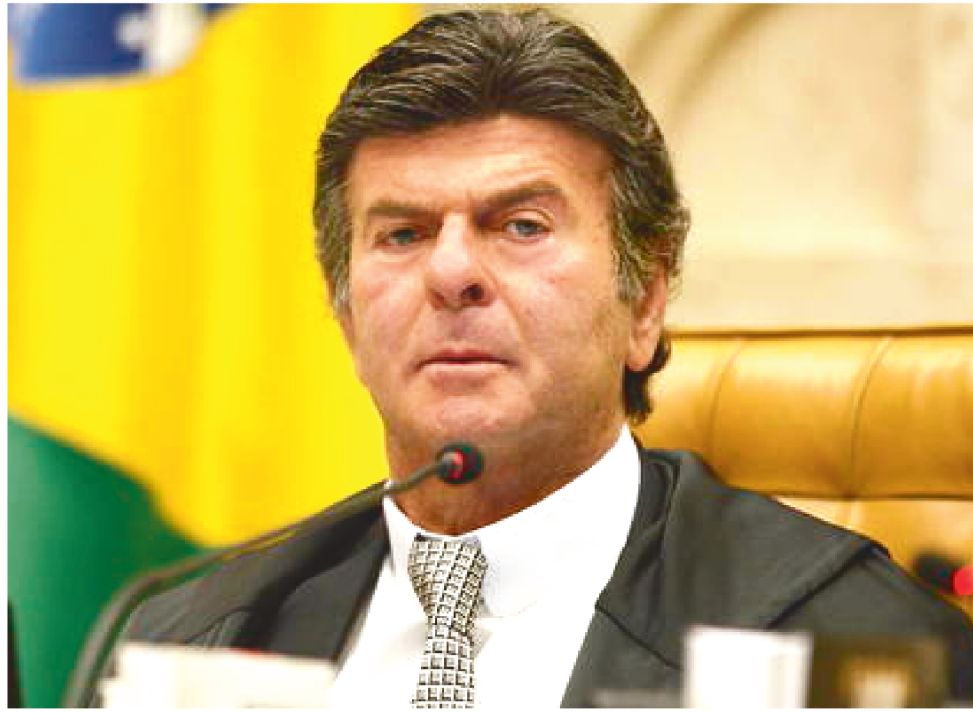
MINISTRO LUIZ FUX É O NOVO PRESIDENTE DO SUPREMO TRIBUNAL FEDERAL

O julgamento é um dos primeiros itens da pauta nesta retomada do Judiciário — em recesso desde o início de julho. A apreciação atende a um pedido do presidente da Câmara dos Deputados, Arthur Lira (PP-AL) que, em encontro com o presidente do STF,