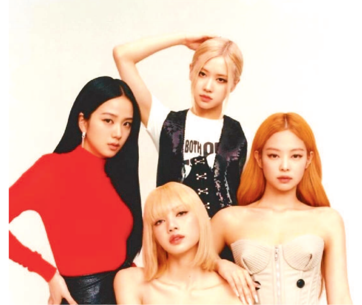
NO TRAILER "BORN PINK" O GRUPO DIVULGA AS NOVIDADES

Um dos maiores nomes do K-pop, o BLACKPINK está definitivamente de volta. O quarteto feminino de k-pop anunciou, neste domingo (31), que lançará um novo álbum e que também sairá em turnê mundial ainda este ano.