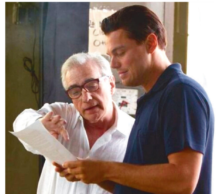
LONGA É ESTRELADO POR DICAPRIO E DIRIGIDO POR SCORSESE

A revista Variety anunciou em uma nota que The Wager, filme produzido pela Apple TV+, baseado no livro homônimo do jornalista David Grann, terá Martin Scorsese como diretor.