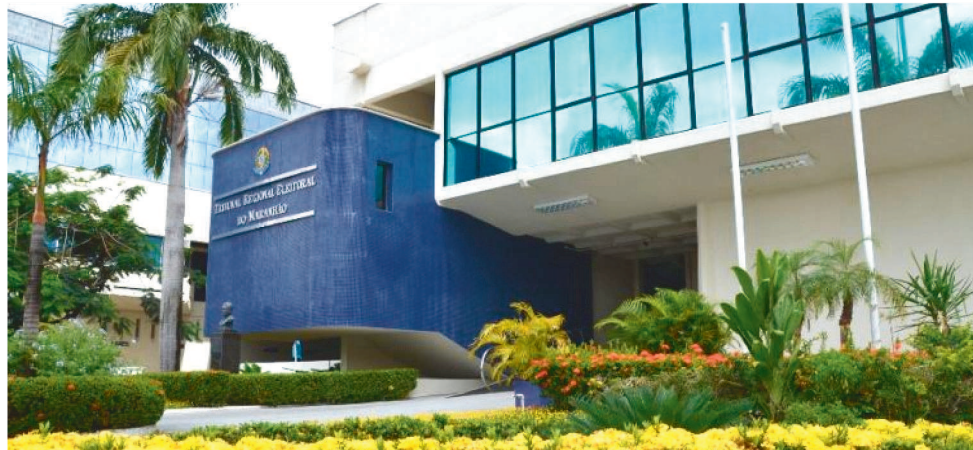
NO MARANHÃO, FORAM REGISTRADOS 955 CANDIDATOS, SENDO 9 GOVERNADORES