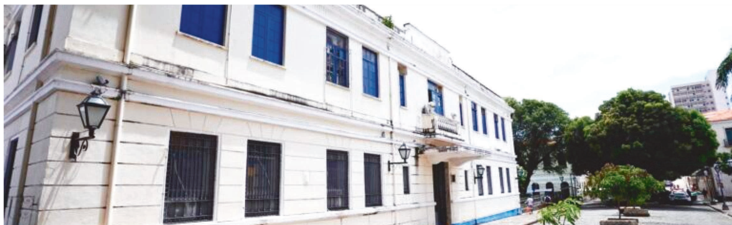
EM 2021, O ÍNDICE TEVE UM AUMENTO DE 7.12% NA DIVULGAÇÃO DE SUAS AÇÕES E FECHOU AQUELE ANO COM 8.19%,

O Ranking de Avaliação dos Portais de Transparência, desenvolvido pelo Tribunal de Contas do Estado do Maranhão (TCE-MA), apontou que, entre setembro de 2020 a junho deste ano, a Câmara Municipal de São Luís (CMSL) atingiu o índice de 8,08% de transparência, que já é considerado o melhor resultado de sua história, segundo estudo realizado pelo Núcleo de Fiscalização II do órgão de controle externo.