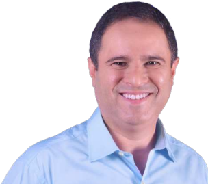
EDIVALDO HOLANDA ■ PSD

"O "Maranhão Já", programa focado na descentralização da industrialização e em investimentos em obras e qualificação profissional, será a principal ação do meu governo para fomentar as vocações produtivas do nosso estado e gerar emprego e renda para os maranhenses. O "Maranhão Já" conta com três frentes: "Emprego Já", "Mais Indústrias", além do "Auxílio Maranhão", que vão atuar integradamente garantindo o desenvolvimento econômico e social. Com o "Emprego Já", por exemplo, vamos realizar mutirões de obra no estado, contratando como mão de obra moradores das cidades onde estão sendo feitos os serviços. Com o "Mais Indústrias" vamos descentralizar a industrialização, atraindo empresas para as diversas regiões do estado, oferecendo incentivos e diminuindo as burocracias para tornar o Maranhão mais atrativo. Também vamos implantar polos industriais conforme a vocação econômica de cada região, além da criação dos centros regionais de capacitação, para garantir que os empregos gerados também fiquem com a população em cada uma dessas áreas. Como prefeito de São Luís, a capital maranhense se destacou nacionalmente, ano a ano, inclusive no período da pandemia, pela geração de emprego. Como governador, não será diferente e vamos transformar o Maranhão em um lugar de trabalho e de oportunidades"