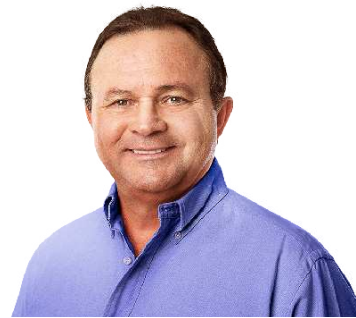
CARLOS BRANDÃO ■ PSB

o Segunda Chance, um programa para estimular a contratação de mulheres de mais de 40 anos, porque sabemos que é difícil conseguir emprego nessa etapa da vida. E vou lançar um amplo programa de qualificação profissional, porque há uma dificuldade de acesso de muitos maranhenses aos melhores postos de trabalho, por conta da falta de qualificação. Esses serão programas de oportunidades para os trabalhadores. Também quero estimular o empreendedorismo e vou criar as Casas do Empreendedor, um espaço equipado com computadores e impressora, internet e apoio jurídico, contábil e comercial para ajudar quem quer começar ou impulsionar sua empresa. E vou ter uma política intensiva de atração de empresas, usando as muitas vocações econômicas do estado, que vão do turismo à agroindústria"