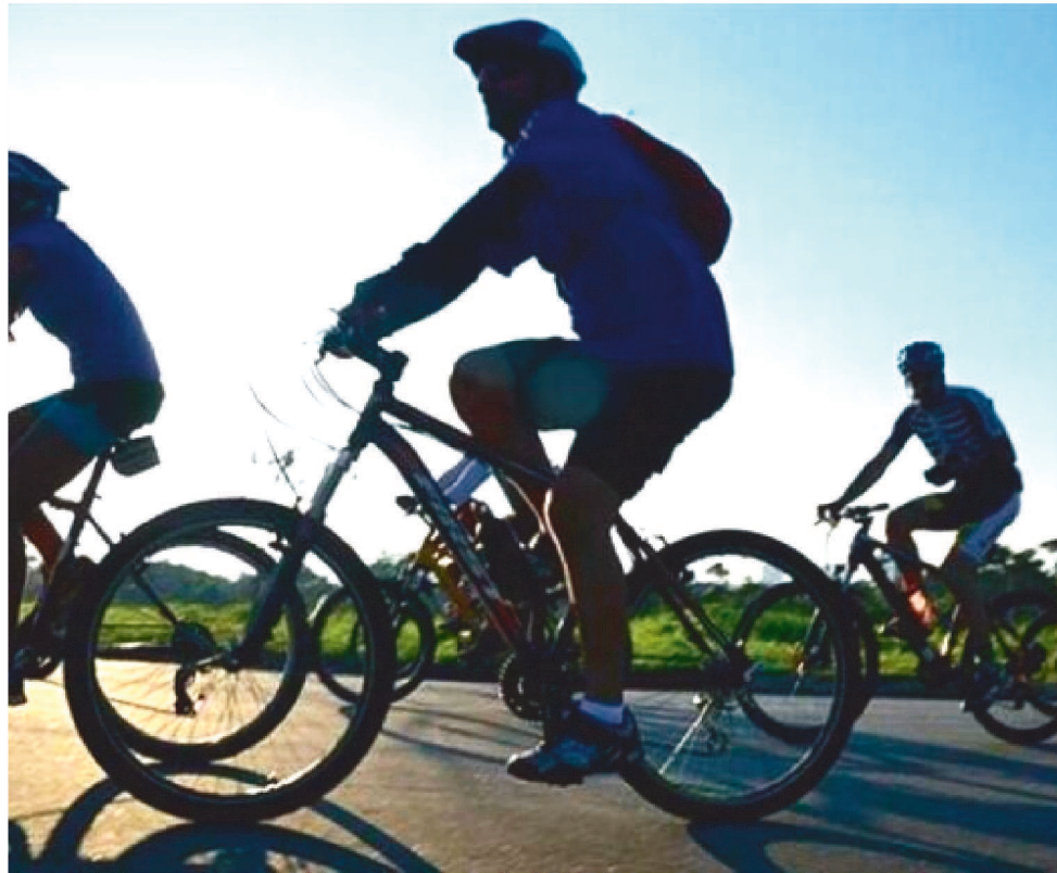
DIA MUNDIAL SEM CARRO SERÁ COMEMORADO NA CAPITAL MARANHENSE NESTE ANO

O Dia Mundial Sem Carro é celebrado em 22 de setembro, a ideia é que neste dia a sociedade possa refletir sobre mobilidade urbana e as consequências do uso de automóveis no meio ambiente, passando a valorizar