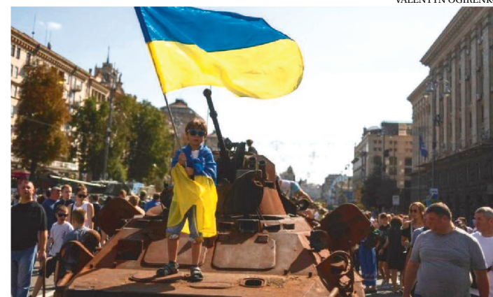
SEPARATISTAS QUEREM ADESÃO DE TERRITÓRIOS À RÚSSIA

Os separatistas pró-russos das regiões de Lugansk, Donetsk e Kherson anunciaram nesta terça-feira (20) a realização de referendos sobre a integração dos territórios à Rússia ainda durante o mês de setembro. Nos últimos dias, as autoridades próximas de Moscou têm procurado acelerar a realização dessas consultas populares, diante dos recentes avanços da contraofensiva ucraniana no Leste do país.