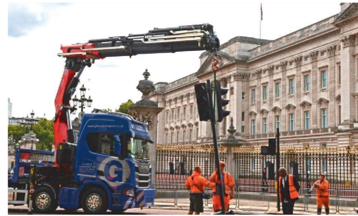
LUTO NACIONAL PELA MORTE DA RAINHA TERMINOU ONTEM

Após 12 dias de homenagens solenes a Elizabeth II, o Reino Unido retomou a vida normal nesta terça-feira (20/9), com o fim do luto nacional e o retorno à realidade de um país em crise e uma monarquia em mudança.