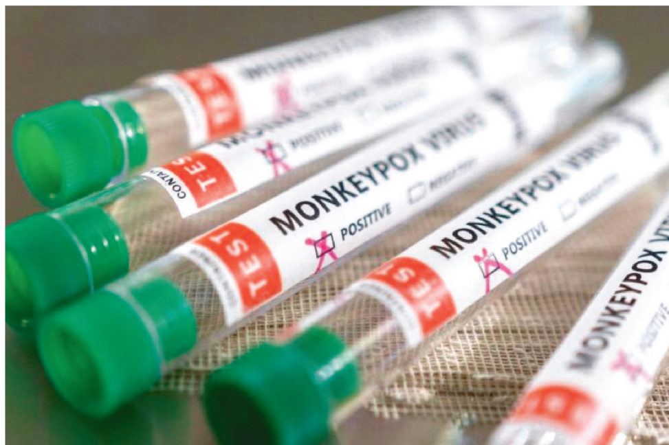
TESTE CONSEGUE DETECTAR REGIÕES GENÔMICAS DOS VÍRUS ORTHOPOX, MONKEYPOX E VARICELLA ZOSTER

Com a resolução de autorização sendo publicada no Diário Oficial da