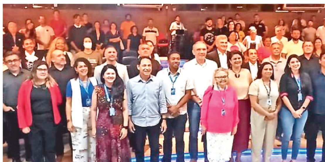
TRADE TURÍSTICO AGUARDA COM EXPECTATIVA, A REALIZAÇÃO DO SALÃO

A expectativa do trade turístico é bastante otimista e pretender consolidar ainda mais, esse roteiro integrado, que une o Ceará, Piauí e Maranhão, que já recebeu premiações, como melhor roteiro turístico do Brasil, pelo Ministério do Turismo e destaca as belezas dos Lençóis Maranhenses, Delta do Rio Parnaíba e a Praia de Jericoacoara. Vai ser sucesso.