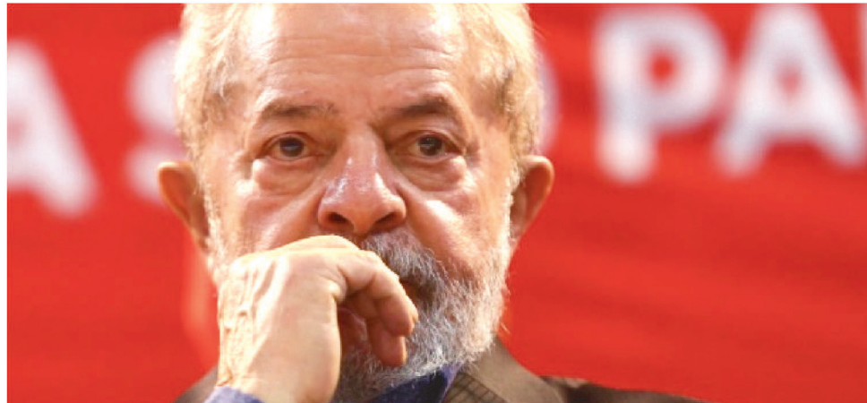
“DO PONTO DE VISTA POLÍTICO, (A VOLTA AO PODER) É MAIS DIFÍCIL DO QUE EM 2002”

No penúltimo dia de campanha, Lula também participou de uma caminhada em Salvador e depois, uma