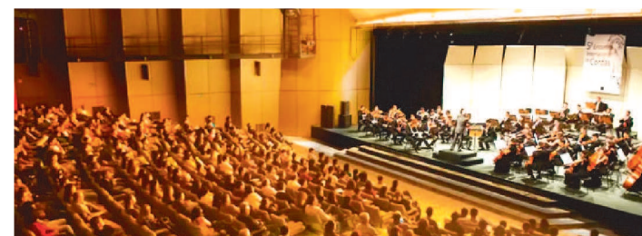
CONCURSO FOI ABERTO PELA MAIOR ESCOLA DE MÚSICA DA AMÉRICA LATINA

O Conservatório Dramático Musical de Tatuí, considerado a maior escola de música e artes cênicas da América Latina e gerido pela Sustentidos Organização Social de Cultura, por intermédio de Contrato de Gestão com a Secretaria de Cultura e Economia Criativa do Estado de São Paulo, anuncia que estão abertas as inscrições para o 1º Concurso de Canto Lírico Joaquina Lapinha. Poderão se inscrever cantores (as) líricos (as) pretos (as), pardos (as) e indígenas, residentes no Brasil e que tenham idade entre 18 e 45 anos, nas categorias voz feminina e voz masculina.