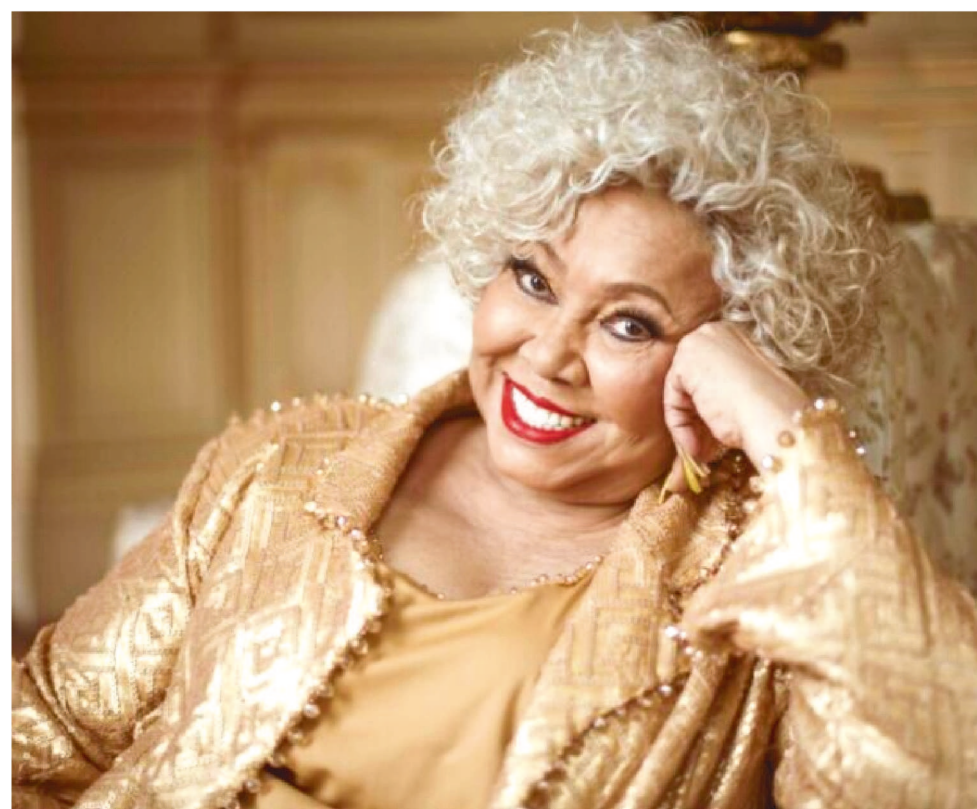
MARROM JÁ SE APRESENTOU PELOS CINCO CONTINENTES, EM MAIS DE 36 PAÍSES

inúmeras premiações internacionais, como o Grammy Latino na categoria “Melhor álbum de samba”, O Pensador de Marfim (concedido pelo Governo de Angola), Diplome de Médaille D’or (da Societé Académique de Arts, Sciences et Lettres de Paris), Extraordinary Contribution to Brazilian Culture and Positive Image (concedida no 9th Annual Brazilian International Press Award. Flórida), Personalidade Negra das Artes (Conselho Internacional de Mulheres) e A Voz da América (ONU).