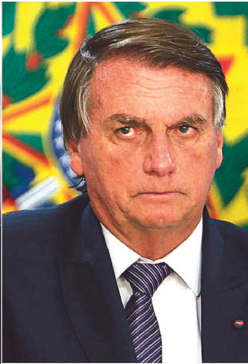
LULA GANHOU EM TODOS OS ESTADOS DO NORDESTE; BOLSONARO VENCEU NO SUL

dos Estados: Pará, Amazonas, Tocantins e Amapá. Na região, o petista registrou sua maior vitória no Pará, com 52% dos votos — o atual presidente teve 40,4%.