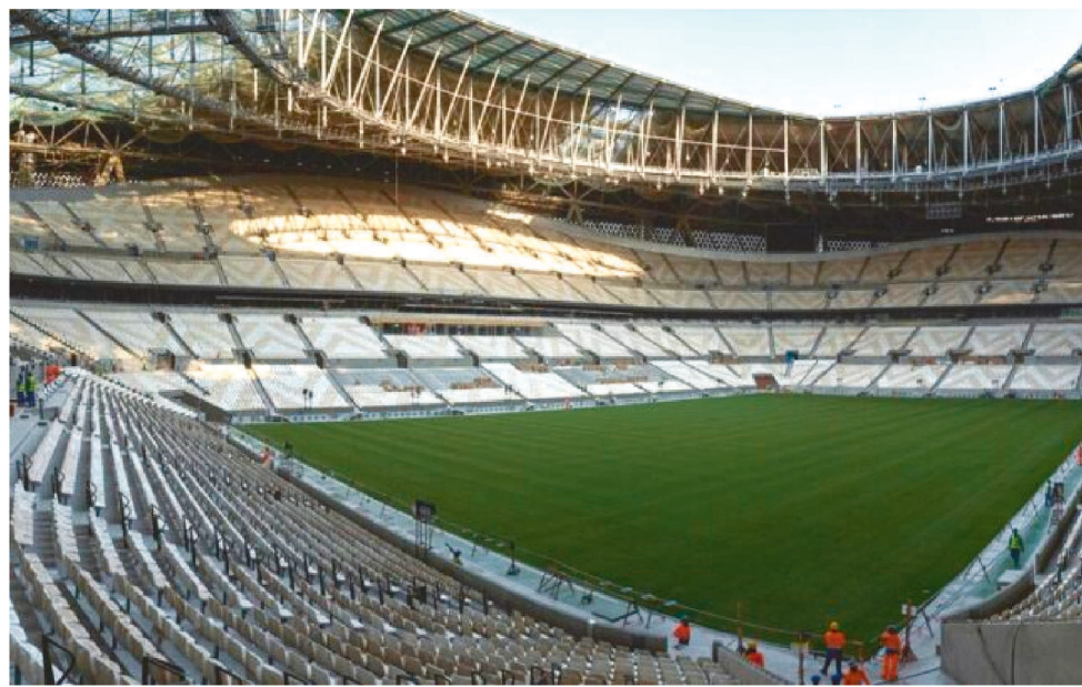
A COPA DO MUNDO DO CATAR ACONTECERÁ DE 20 DE NOVEMBRO A 18 DE DEZEMBRO