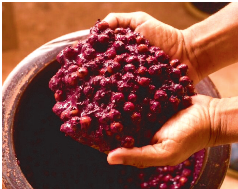
A TRADICIONAL FESTA DA JUÇARA ESTE ANO DEVE COMEÇAR NO DIA 9 DE OUTUBRO

A primeira etapa da obra foi realizada no período junino, para que o local pudesse abrigar a programação do São João do Maranhão. Para isso, foram feitas drenagem; reforma de 21 barracas; pavimentação com brita; adaptação de área para estacionamento; reforma de palco; iluminação e sinalização.