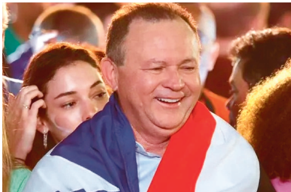
O GOVERNADOR REELEITO AGRADECEU A CONFIANÇA DO ELEITORADO MARANHENSE