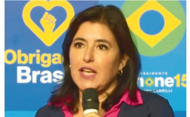
NÃO ESPEREM DE MIM QUE EU FIQUE OMISSA, DISSE TEBET

Terceira colocada nas eleições, com 4,17% dos votos (4,909 milhões), Simone Tebet afirmou que agora é a “hora dos partidos se posicionarem e se pronunciarem” sobre o seu apoio no segundo turno das eleições. “Espero que o façam, e o façam rapidamente (a definição do apoio), para que depois eu possa, como candidata à presidência, neste momento tão complexo, me posicionar”, disse ela, em discurso onde reconheceu a derrota nas eleições.