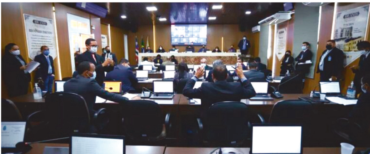
A SESSÃO PODE SER ACOMPANHADA, AO VIVO, NO CANAL DA CÂMARA NO YOUTUBE

A Câmara de Vereadores de São Luís realizará, nesta segunda-feira (10), sessão ordinária do período legislativo. Estão na pauta, para deliberação do plenário, 23 projetos de lei, 12 projetos de decreto legislativo, oito projetos de resolução, 23 requerimentos, duas moções, além de 11 indicações. A sessão poderá ser acompanhada por meio do canal no Youtube da Câmara.