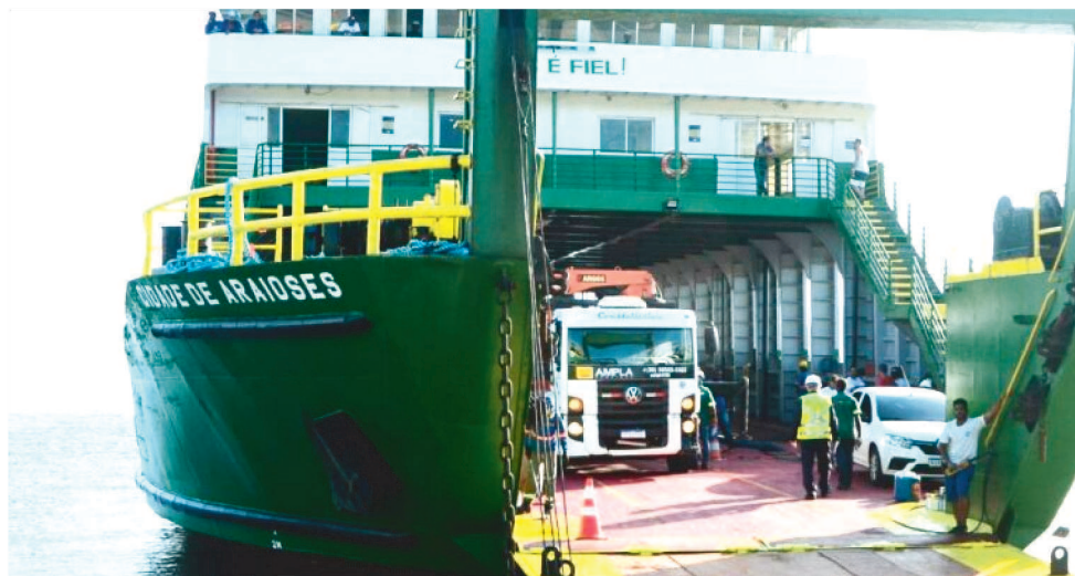
A VENDA ANTECIPADA TAMBÉM PODE SER REALIZADA NOS GUICHÊS

"A venda online está funcionando normalmente com a limitação de 30% da carga de cada viagem para a venda