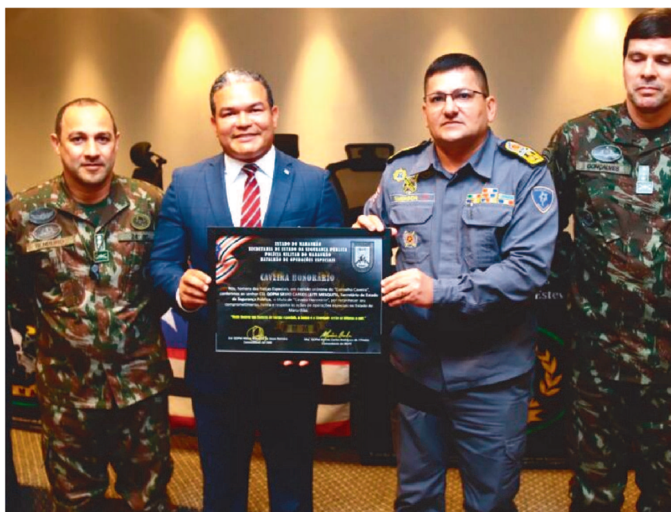
"É UMA EXPERIÊNCIA QUE VAI GARANTIR MAIS APTIDÃO AOS NOSSOS POLICIAIS"

O seminário é realizado pela Polícia Militar do Maranhão (PMMA) e