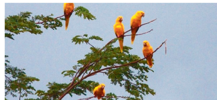
FORAM ENCONTRADAS ESPÉCIES CRITICAMENTE AMEAÇADAS

As atividades do Plano de Ação Territorial para a Conservação de Espécies Ameaçadas de Extinção do Território Meio Norte (PAT Meio Norte) estão em andamento e a primeira expedição de campo no estado do Maranhão aconteceu entre os dias 20 e 30 de setembro, sob coordenação da Secretaria de Estado de Meio Ambiente (SEMA), tendo encontrado espécies da flora e fauna criticamente ameaçadas de extinção, nos municípios de Açailândia, Bom Jesus das Selvas e Cidelândia.