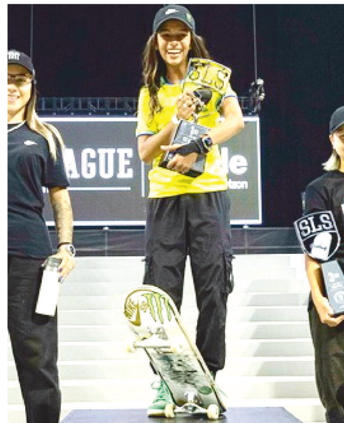
A FADINHA VENCEU SEIS ETAPAS DA SLS E VAI PARA A FINAL

GAUDÊNCIO CARVALHO Especial para O Imparcial