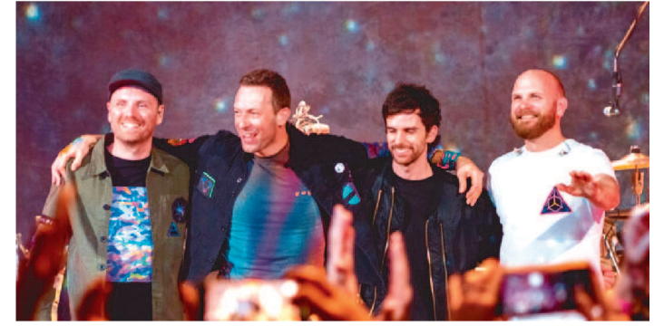
SHOWS FORAM ADIADOS DEVIDO À SAÚDE DE CHRIS MARTIN

O Coldplay anunciou em suas redes sociais as novas datas para os shows adiados no Brasil neste mês de outubro. Nesta segunda-feira (10), a banda informou os fãs sobre quando e onde ocorrerão as novas apresentações, com uma mudança importante.