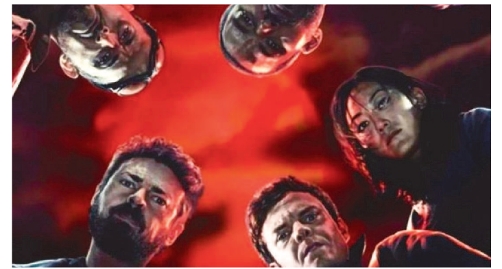
PERSONAGENS DEVEM OCUPAR LUGARES DE MAEVE E STARLIGHT NOS SETE

O Amazon Prime Video divulgou nesta segunda-feira (10) as primeiras imagens da quarta temporada de The Boys.