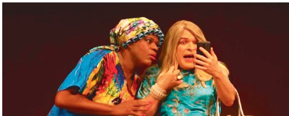
A PEÇA PÃO COM OVO É UMA DAS GRANDES ATRAÇÕES DA PROGRAMAÇÃO NA ILHA

A iniciativa “Vem Pro Parque, Criançada”, uma ideia do Governo do Estado, está proporcionando durante todo o mês de outubro eventos para