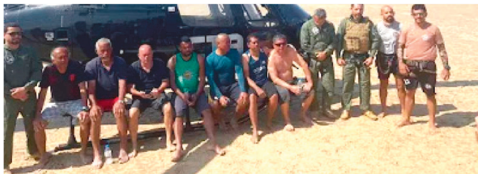
OS NOVE TRIPULANTES FORAM RESGATADOS POR UM HELICÓPTERO DO CTA

N a manhã do último domingo (9), nove tripulantes de uma embarcação que naufragou, no litoral do município de Tutóia, foram resgatados em alto mar. De acordo com informações da Capitania dos Portos do Maranhão (CPMA), o naufrágio da draga “Tremembés” ocorreu por volta das 5h40, a cerca de 9km da costa de Tutóia.