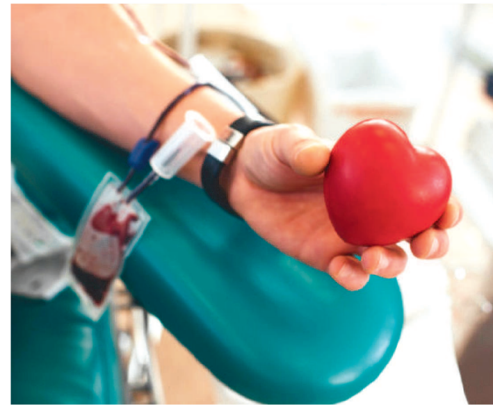
DIA D SERÁ REALIZADO NESTA TERÇA, A PARTIR DAS 8H

Doar sangue salva vidas! Apesar de todos os esforços para aumentar as doações de sangue, os estoques do Centro de Hematologia e Hemoterapia do Maranhão (Hemomar) estão constantemente baixos e, às vezes, em níveis críticos.