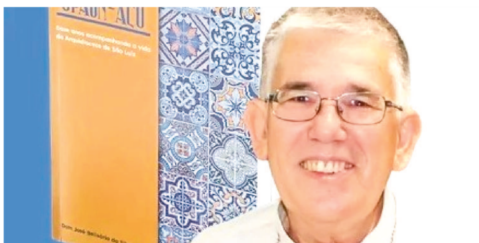
OBRA REÚNE 115 ARTIGOS JORNALÍSTICOS ESCRITOS ENTRE OS ANOS DE 2010 A 2021