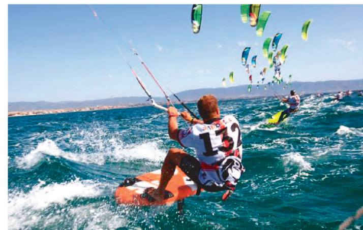
AS INSCRIÇÕES PODEM SER REALIZADAS ATÉ 4 DE NOVEMBRO

Já estão abertas as inscrições para o Circuito Brasileiro de Kitesurf. O evento, que será realizado em São Luís, a partir do dia 05 de novembro, vai abranger três competições distintas: o Campeonato Brasileiro de Fórmula Kite, o Campeonato Maranhense de Bidirecional e o Campeonato Pan-Americano de Fórmula Kite – este último, classificatório para o Jogos Olímpicos de Paris, em 2024, e com previsão de reunir atletas de pelo menos 25 países. No Campeonato Brasileiro de Fórmula Kite serão 03 categorias: Tubular, Open Hydrofoil e Fórmula Kite. Já no Campeonato Maranhense, serão disputadas as categorias até 24 anos; 25 a 34 anos; 35 a 44 anos; 45 ou mais; e Feminino, nas modalidades Downwind e Regata.