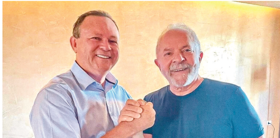
BRANDÃO E O SEU GRUPO POLÍTICO APOIARÁ CANDIDATURA DO EX-PRESIDENTE LULA

Para Carlos Brandão (PSB), que venceu no primeiro turno e se reelegeu governador no Maranhão com um total de 1.769.187 votos, ou seja, 51,29% dos votos válidos e nestas eleições contou com o apoio do ex-governador Flávio Dino, agora senador eleito pela mesma legenda, ressaltou que o seu grupo político apoiará o ex-presidente Lula, que tenta a sua recondução ao Palácio do Planalto. “Sem dúvida alguma, nossa posição é a de ampliar, no Maranhão, a vantagem que Lula conquistou. No primeiro turno, 68,84% dos eleitores maranhenses o escolheram como presidente. Nossa meta, agora, é ultrapassarmos esse patamar. Tenho certeza de que, com Lula presidente, o Maranhão terá muito mais condições de trilhar os caminhos do desenvolvimento, acima de tudo, com justiça social. Queremos gerar empregos e cui-