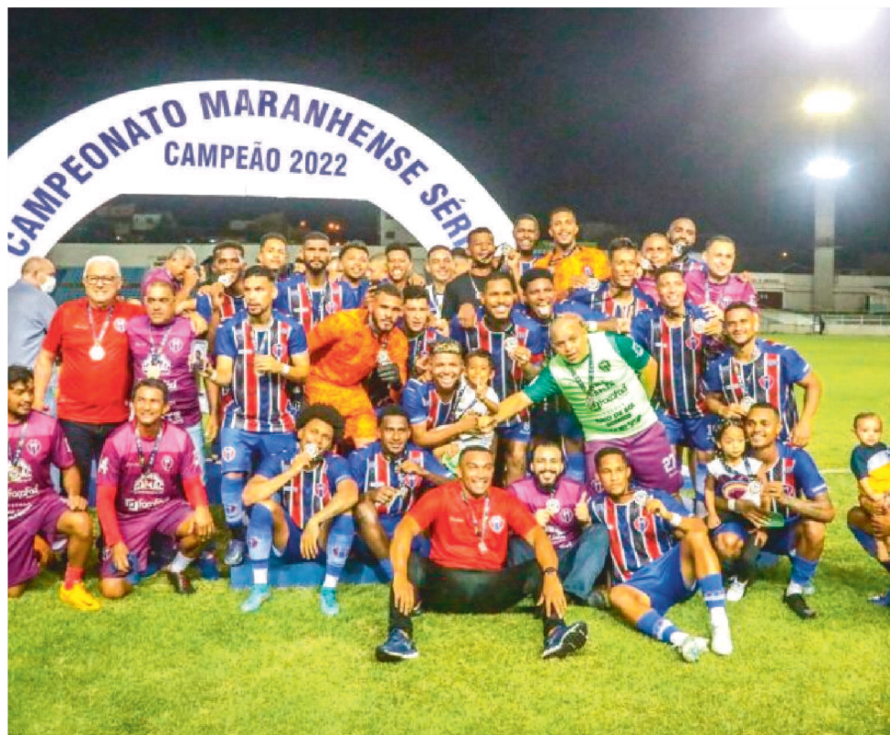
O MAC AGORA VAI EM BUSCA DO TÍTULO DA COPA FMF PARA DISPUTAR A SÉRIE D

Campeão da Série B do Maranhense, o MAC estreia contra o Juventude Samas, domingo, às 15h30, no Estádio Pinheirão. O clube da capital preferiu prestigiar vários atletas que se destacaram na competição, daqui mesmo e