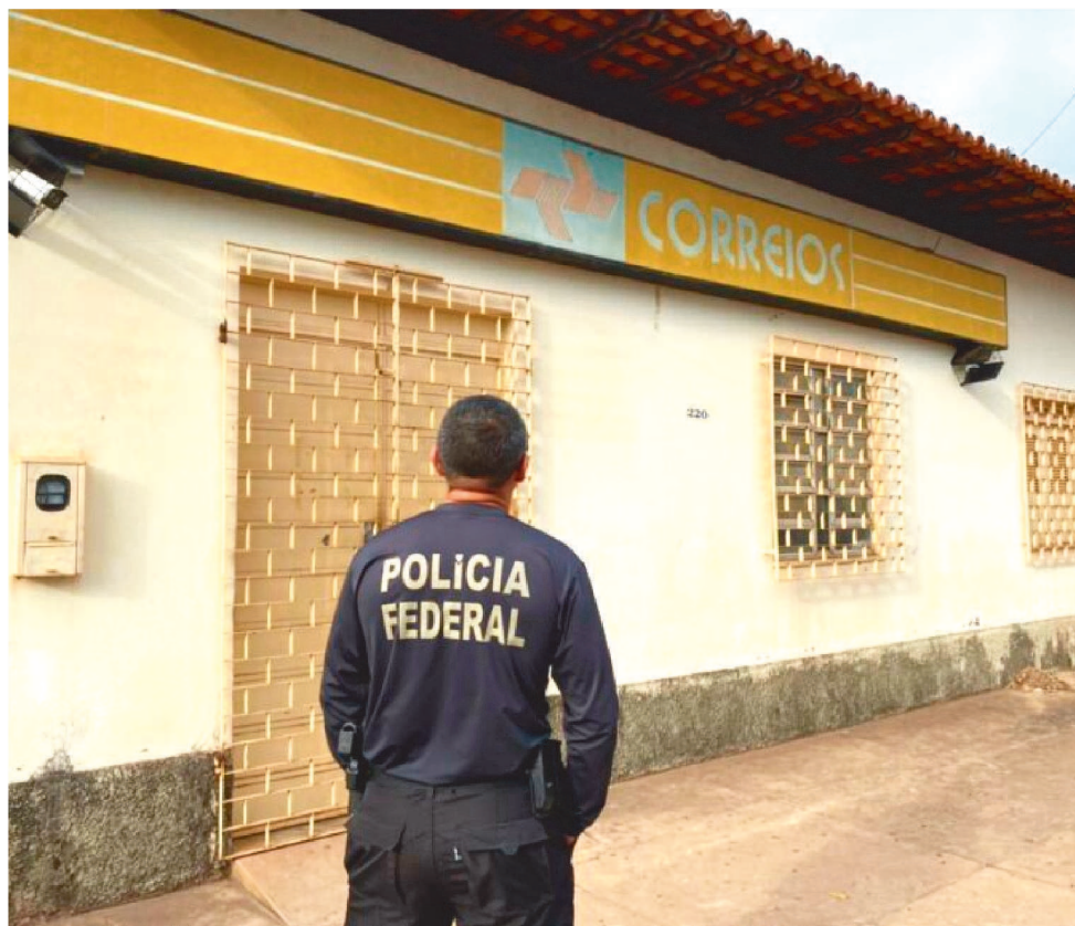
A POLÍCIA FEDERAL CUMPRIU MANDADOS EM VÁRIOS ENDEREÇOS EM TRÊS CIDADES

A fraude consistia na inserção de dados falsos em sistema corporativo dos Correios, simulando remessa de encomendas com a contratação de serviço adicional de valores e posterior pedido de indenizações. Como a encomenda de fato não existia, nunca chegava ao destinatário, portanto, era tratada como “extraviada”, gerando ao remetente o direito de ressarcimento e causando um prejuízo aos cofres públicos.