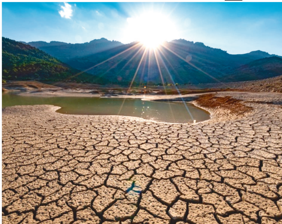
MAIORES ESTRAGOS SÃO CAUSADOS PELA AGROPECUÁRIA, QUE OCUPA 5,7 MILHÕES DE HECTARES DO BIOMA

Caatinga é um bioma totalmente brasileiro. Mais de um quarto do bioma, 25,59%, ou seis milhões de hectares, já foram modificados pelos humanos nos últimos 37 anos. Pouco mais de 15% foram alterados por queimadas — o equivalente a 13.770