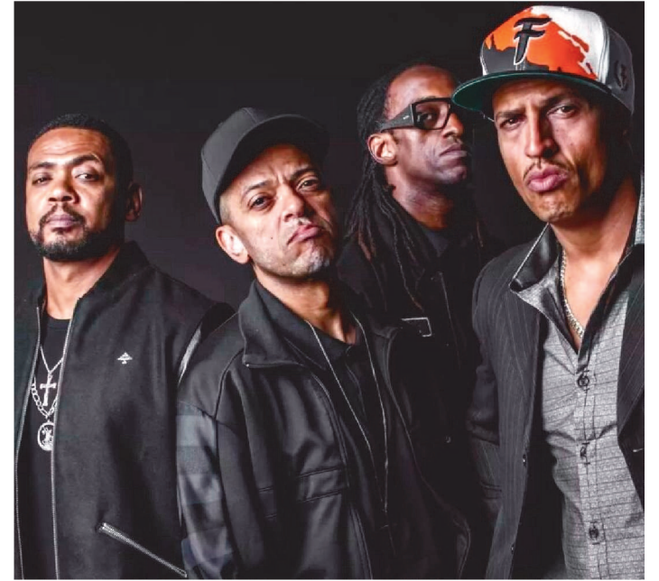
A DECLARAÇÃO FOI FEITA POR MANO BROWN DURANTE SHOW

A “presença real e intensa” de Racionais MC's estará de volta além dos palcos. O grupo de rap mais relevante do país anuncia que o próximo álbum será lançado em 2023.