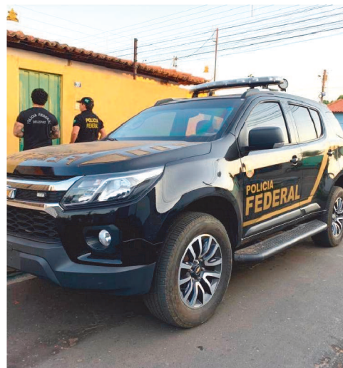
A ação policial contou com a participação dos Correios que alertou so-

Na mitologia grega, Apáte era um espírito que personificava o engano e a fraude. Foi, junto com o seu correspondente masculino Dolos (espírito da artilosidade) um dos espíritos que saíram da caixa de Pandora.