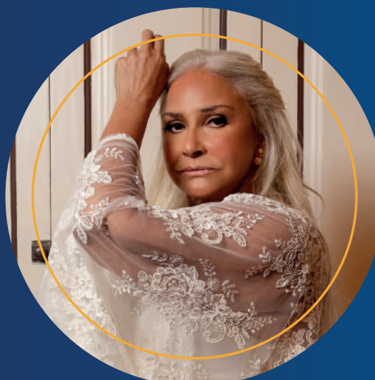
FAFÁ DE BELÉM