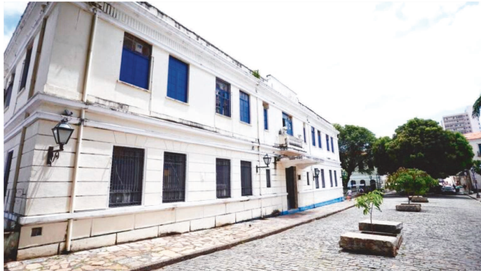
PROPOSIÇÕES FORAM FEITAS PELOS VEREADORES DURANTE AS ÚLTIMAS SESSÕES

Dados mais recentes do Instituto Brasileiro de Geografia e Estatística (IBGE), de 2020, apontam que o Maranhão ainda possui o maior percentual de insegurança alimentar do país – mais de 1,4 milhão de maranhenses não se alimentam de maneira adequada.