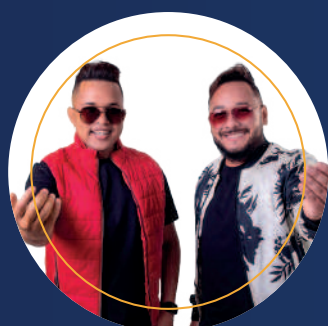
MESA DE BAR

Ações de saúde, oficinas socioeducativas, difusão da leitura / contação de histórias, atividades de lazer/recreativas, dentre outras.