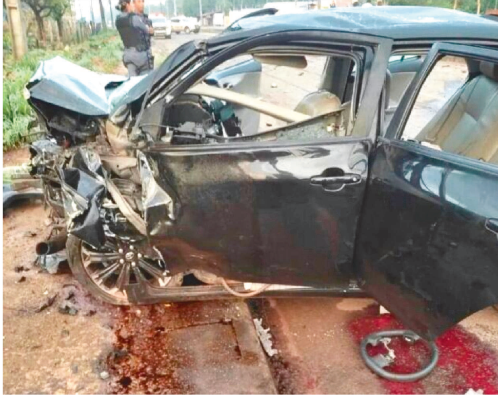
NA CIDADE DE IMPERATRIZ, UMA COLISÃO FRONTAL DEIXOU DUAS PESSOAS MORTAS

Na madrugada, no Km 506 da BR-226/MA, município de Lajeado No-