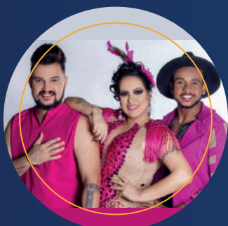
MIX IN BRAZIL