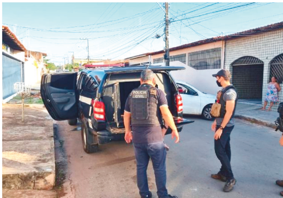
A OPERAÇÃO ACONTECEU NO MARANHÃO E OUTROS CINCO ESTADOS DO PAÍS

O Maranhão e outros cinco estados da federação foram alvos de uma megaoperação intitulada de "Operação Efiates" que tem como base investigações que apuram a violação de lacres e troca de material entorpecente apreendido, constatada durante uma incineração de drogas realizada em abril deste ano, em Cárceres, no Mato Grosso. A Polícia Civil do Maranhão, em apoio da Polícia Civil do Mato Grosso cumpriram mandados de busca e apreensão e de prisão.