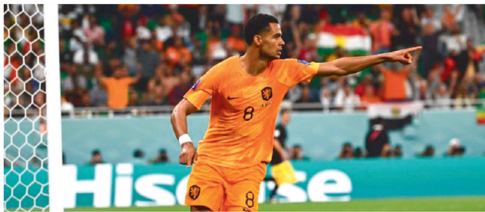
CODY GAKPO COMEMORA GOL NA VITÓRIA DA HOLANDA POR 2 X 0 SOBRE O SENEGAL

Foi com mais dificuldade do que se imaginava. Principalmente pelo fato de Senegal não ter o seu astro Sadio Mané, cortado da Copa por lesão. Mas com gols de Gakpo e Klaassen, no segundo tempo, a Holanda venceu na sua estreia na Copa por 2 a 0, nesta segunda-feira, no estádio Al Thumama, e divide a liderança do Grupo A com o Equador – que na partida de abertura do Mundial superou o Catar pelo mesmo placar.