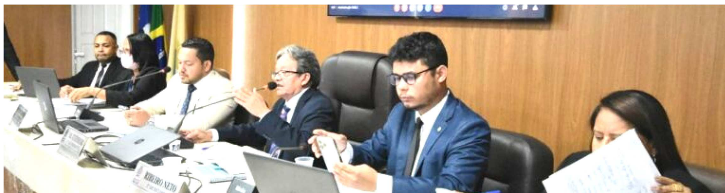
COM A DERRUBADA DOS VETOS, AS LEIS SERÃO PROMULGADAS PELO LEGISLATIVO E ENTRARÃO EM VIGOR APOS SUA PUBLICAÇÃO

Iniciativas tratam da prevenção ao câncer, combate a doenças graves, atendimento de crianças e adolescentes com TEA à assistência social e cuidados da nossa população neste período de pós-pandemia Com a derrubada dos vetos, as leis serão promulgadas pelo Legislativo ludovicense e entrarão em vigor após sua publicação no Diário Oficial