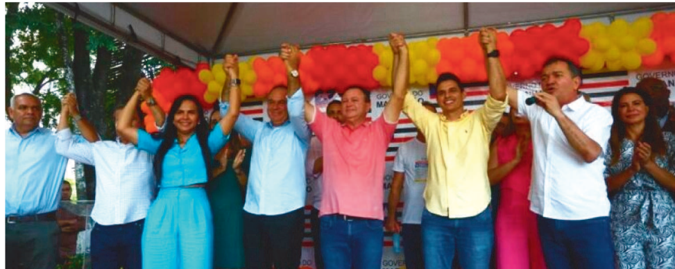
O GOVERNADOR ENTREGOU UMA UNIDADE DO VIVA PROCON NA CIDADE DE SÃO MATEUS

Na cidade de São Mateus, o governador visitou o Hospital Regional de São Mateus, que foi entregue em agosto deste ano, e que possui mais de 40 leitos de enfermagem, além de leitos de isolamento, salas cirúrgicas, sala de ultrassom e raio X.