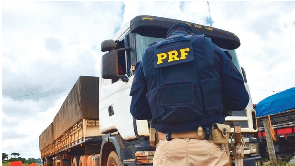
OPERAÇÃO DA PRF COMEÇOU DIA 22 E SE ESTENDEU ATÉ O DIA 25 DE DEZEMBRO

No dia 25 de dezembro, um acidente deixou uma pessoa ferida, na BR 135, km 42, sentido crescente, ocorreu um acidente do tipo saída de leito carroçável envolvendo uma HONDA/BIZ