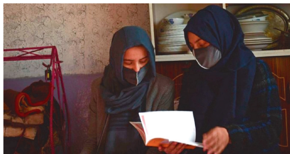
TALIBÃ PROIBIU QUE AS MULHERES TRABALHEM NESTE TIPO DE ORGANIZAÇÃO

A Organização para a Conferência Islâmica (OIC) condenou a proibição neste domingo e seu secretário-geral, Husein Ibrahim Taha, apelou “forte-