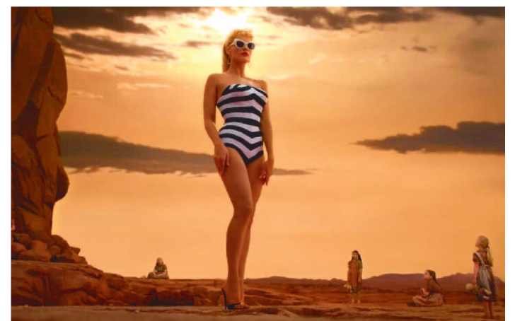
O LONGA TEM MARGOT ROBBIE INTERPRETANDO A BARBIE

O filme Barbie será lançado apenas em julho de 2023. Porém, o primeiro teaser da obra já foi o suficiente para enlouquecer os fãs na internet e gerar um enorme hype. Dirigido pela celebrada Greta Gerwig (Frances Ha), o longa tem Margot Robbie, Ryan Gosling, Will Ferrell, Helen Mirren e Kate McKinnon em seu elenco principal. Uma coisa chamou muito a atenção dos cinéfilos de plantão: o vídeo é uma grande referência ao filme 2001: Uma Odisseia no Espaço, do lendário Stanley Kubrick.