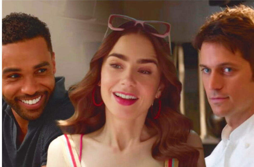
AMANHÃ A 3ª TEMPORADA DA SÉRIE DE SUCESSO EMILY EM PARIS CHEGA À NETFLIX

Para ele ser Mister Brasil é ‘Guardada as proporções, ser um líder, um amplificador de causas e ideias positivas em prol de uma sociedade menos desigual. Ser o novo vencedor do Mister Brasil é uma grande oportunidade de colocar o Maranhão de onde sou, o Nordeste em geral, em um lugar de destaque, assim como outros misteres que me antecederam já fizeram para seus estados. Quero usar meu título para coligar todas as regiões em prol de causas pertinentes. O Mister Brasil tem este poder de ajudar, unir, levar alegria e esperança. Carregarei com este título o poder de união diante de lutas e causas benéficas. Divido minha alegria e honra de carregar este título, a todas as pessoas que tem o amor ao próximo, sabendo que