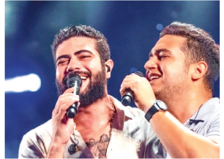
DUPLA ESTARÁ NO FESTIVAL “PRA COMEÇAR”, DIA 21 JANEIRO