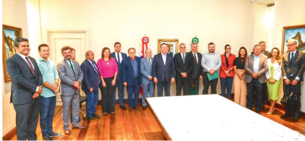
GRUPO POSSUI EQUIPES DO TJ-MA, MP-MA, DEFENSORIA, PREFEITURAS, SECID E ITERMA

Entretanto, o ponto focal do grupo serão as comunidades quilombolas e