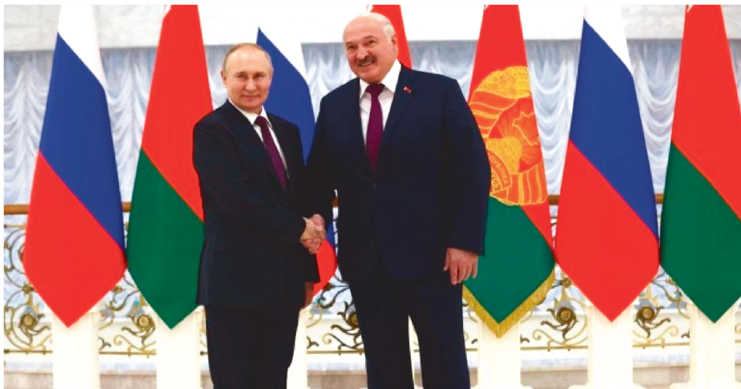
PUTIN, REUNIU-SE COM LÍDER DE BELARUS, ALEXANDER LUKASHENKO, E AFIRMOU QUE NÃO PRETENDE ANEXAR O PAÍS VIZINHO

O Dia de São Nicolau foi lembrado pelos ucranianos, ontem, em meio à escuridão.