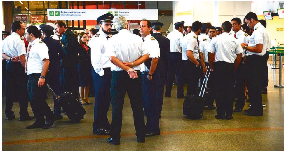
CATEGORIA REIVINDICA AUMENTO SALARIAL DE ACORDO COM O INPC E GANHO REAL

Segundo o SNA, a greve ocorre respeitando a decisão do Tribunal Superior do Trabalho (TST) da obrigatoriedade de manter as atividades de 90% dos comissários e pilotos durante a paralisação. Ainda de acordo com o