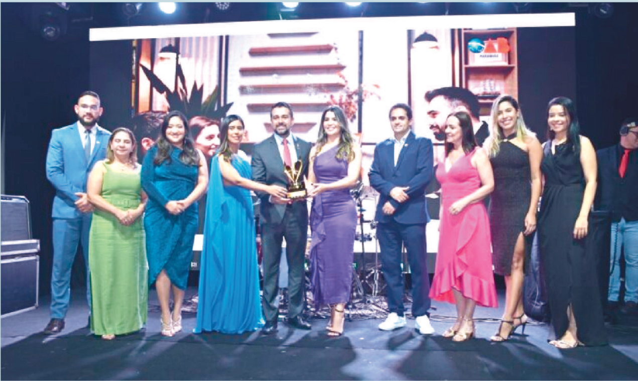
Toda a diretoria da OAB-MA marcou presença para receber o Prêmio Instituição 2023 pela campanha "Advogada e Advogado têm rosto, nome e OAB"