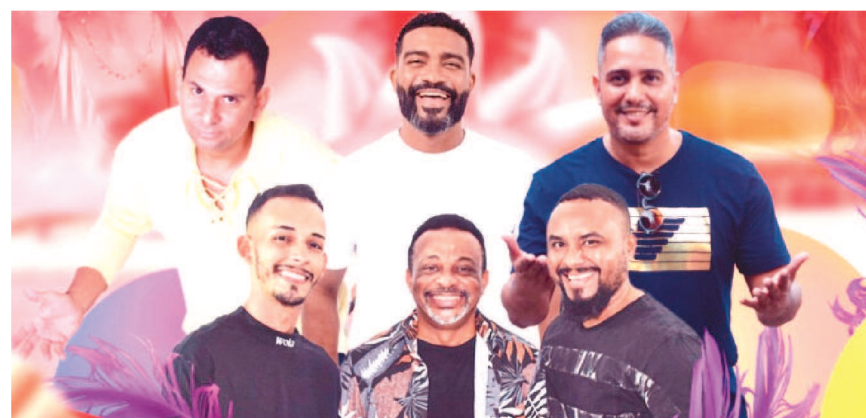
Os grupos Feijoada Completa, Samba de Reis, Pagode do Ivan e ainda o Gargamel