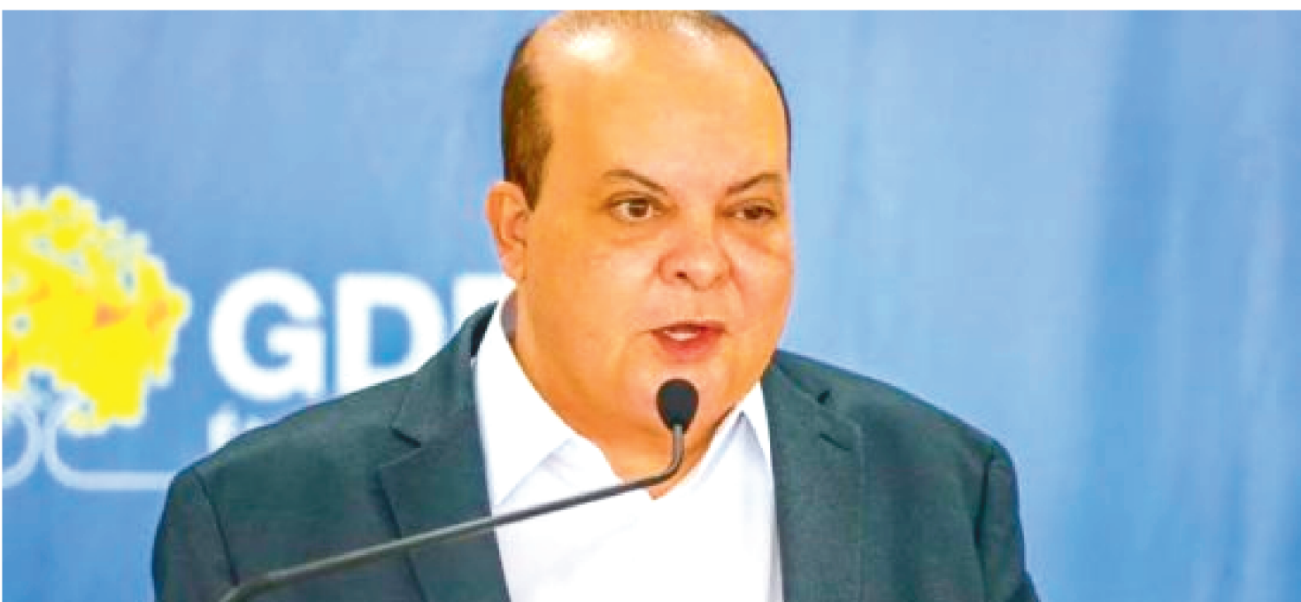
IBANEIS E ADVOGADOS DIZEM QUE NÃO HOUVE ALTERAÇÃO DE ÚLTIMA HORA DO PLANO PERMITINDO A ENTRADA DE MANIFESTANTES

Dois documentos são os alicerces da defesa do governador afastado Ibaneis Rocha contra as acusações de conivência com os atos golpistas na Esplanada. A narrativa dele é de provar que não houve omissão.