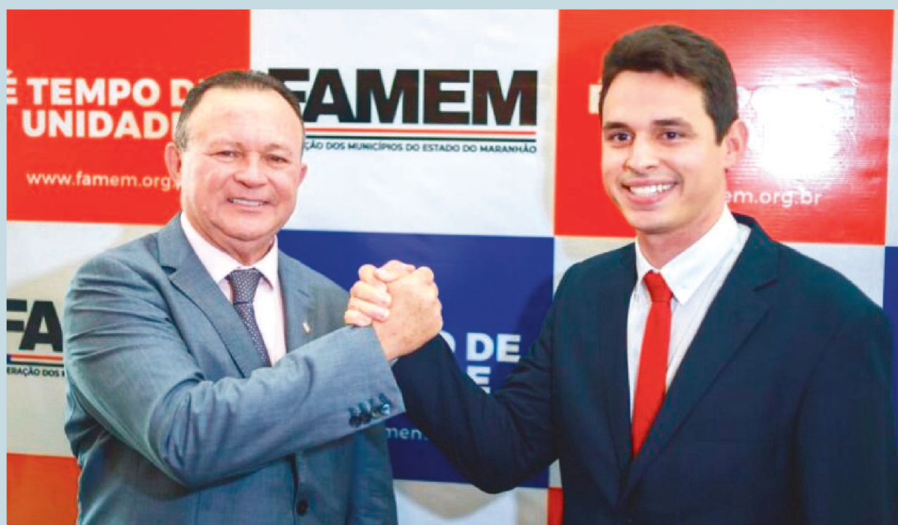
O governador Carlos Brandão fez questão de comparecer ao evento para prestar apoio a pauta municipalista