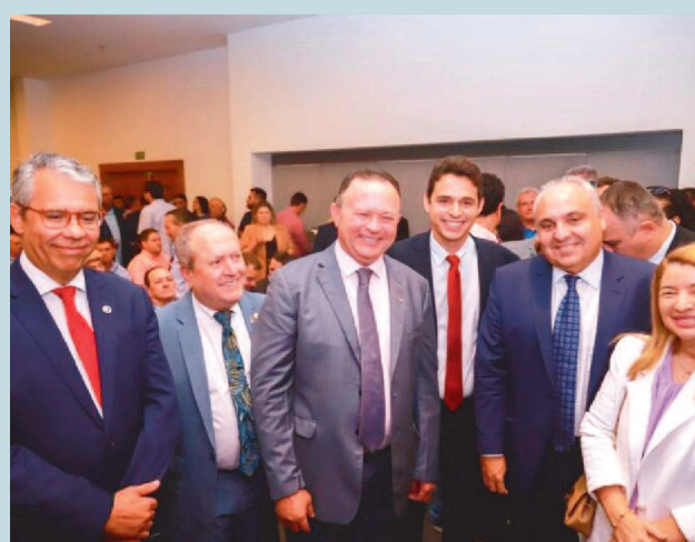
Autoridades de todos os poderes estiveram presentes