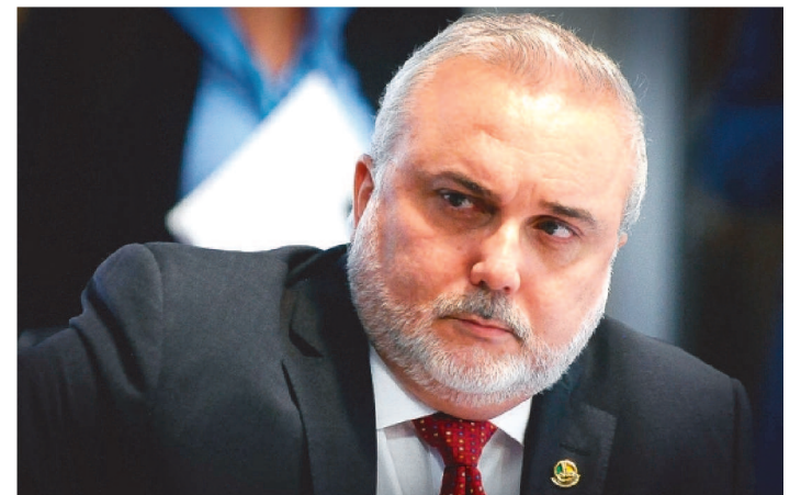
ESTATAL RECEBEU OFÍCIO DO MINISTÉRIO DE MINAS E ENERGIA

A Petrobras informou nesta sexta-feira (13) que recebeu, do Ministério de Minas e Energia, a confirmação do senador Jean Paul Prates (PT-RN) como indicado para exercer a Presidência da estatal. O ofício foi recebido ontem (12) pela empresa, segundo nota divulgada à imprensa.