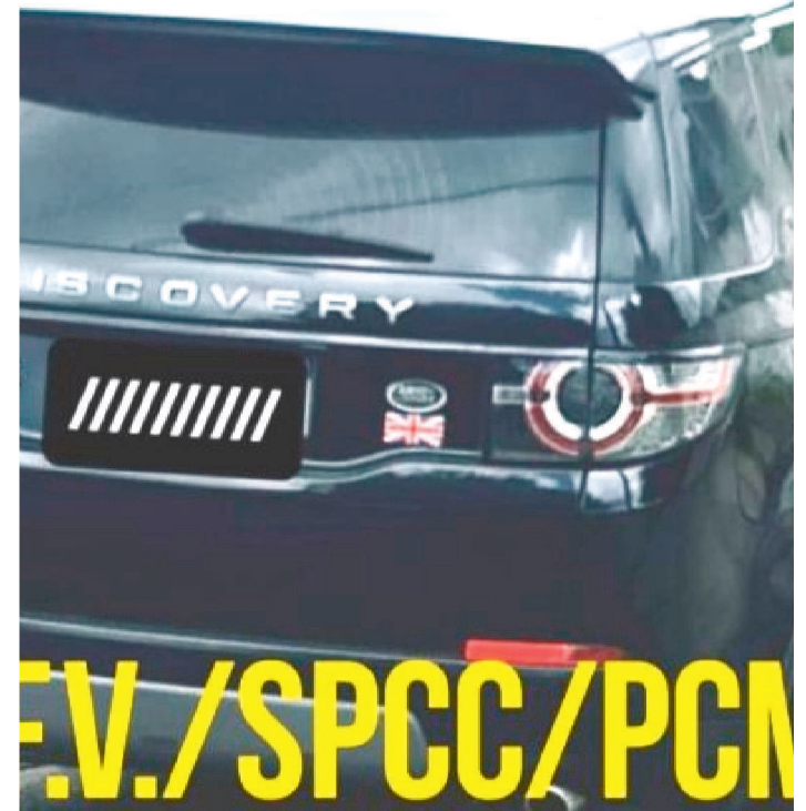
O VEÍCULO LAND ROVER FOI ENCAMINHADO PARA PERÍCIA

A Polícia Civil, por meio da Delegacia de Roubos e Furtos de Veículos (DRFV), vinculada à Superintendência de Polícia Civil da Capital (SPCC), com apoio da Delegacia de Roubos e Furtos de Veículos e Cargas do Ceará (DRFVC), conseguiu localizar no bairro Araçagy, em São José de Ribamar, cidade localizada na região metropolitana de São Luís, um veículo Land Rover, modelo Discovery, com sinais identificadores adulterados, o que apontou indícios de clonagem de um veículo do mesmo modelo da cidade de Fortaleza-CE.