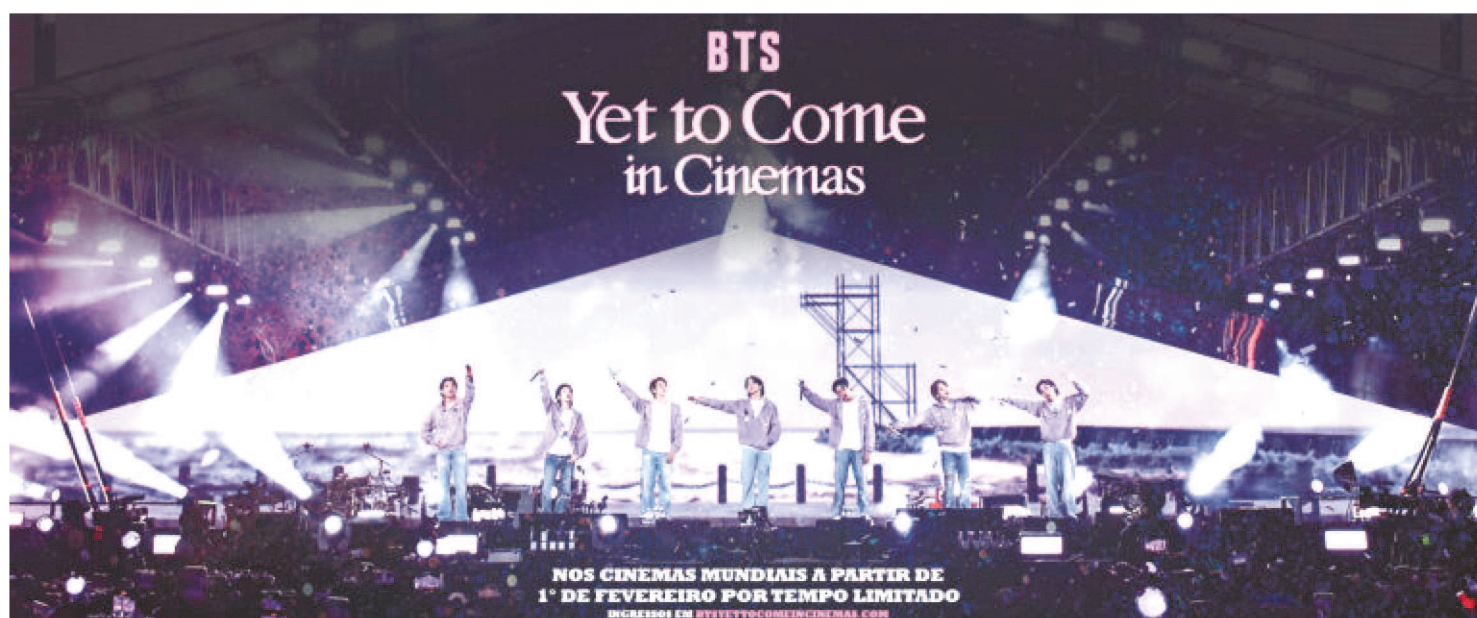
COM CORTE CINEMATOGRAFICO ESPECIAL, A EXIBIÇÃO DO SHOW APRESENTARÁ OUTROS ÂNGULOS E UMA VISÃO NOVA DO SHOW

Se você é de São Luís e é um ARMY, é melhor já se preparar. O show 'Yet To Come' do BTS, um dos maiores grupos de K-Pop do mundo será exibido numa telona de cinema.