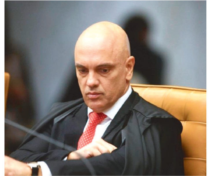
O MINISTRO DO STF ATENDEU A UM PEDIDO FEITO PELA PGR

O ministro do Supremo Tribunal Federal (STF) Alexandre de Moraes abriu um novo inquérito contra o governador afastado do Distrito Federal, Ibaneis Rocha (MDB), e o ex-secretário de Segurança do DF Anderson Torres, ex-ministro da Justiça de Jair Bolsonaro (PL), por omissão nos atos de vandalismo aos edifícios-sede dos Três Poderes, no último domingo. A decisão foi publicada no Diário de Justiça, nesta sexta-feira (13/1).