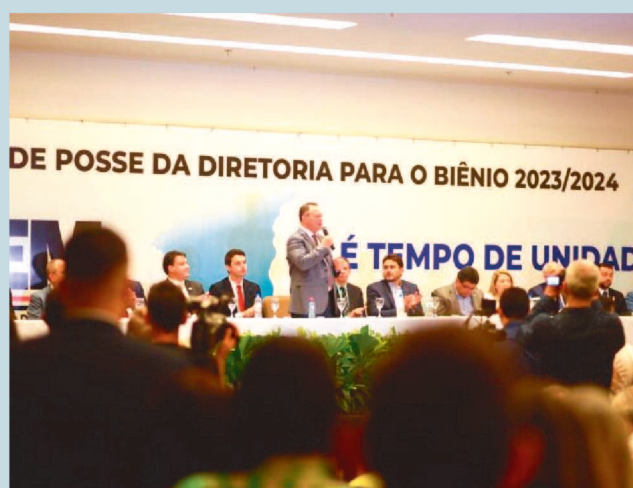
Brandão elogiou o espírito de unidade da federação