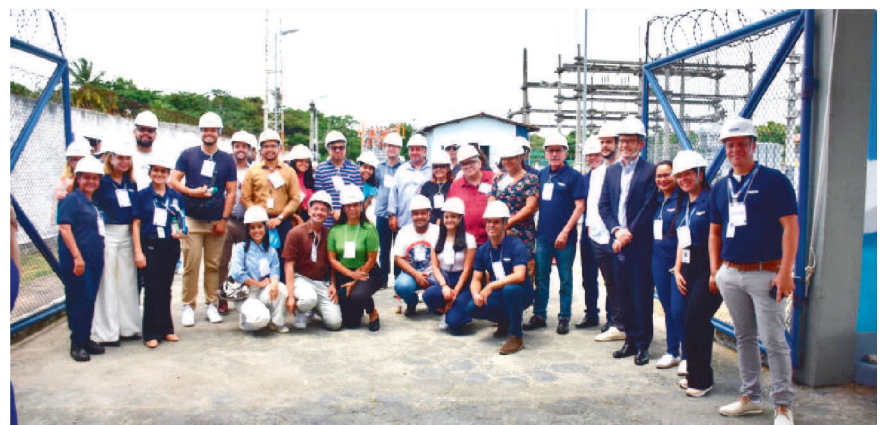
Equipes de comunicadores da Equatorial Maranhão durante visita à Subestação no Giro Equatorial.