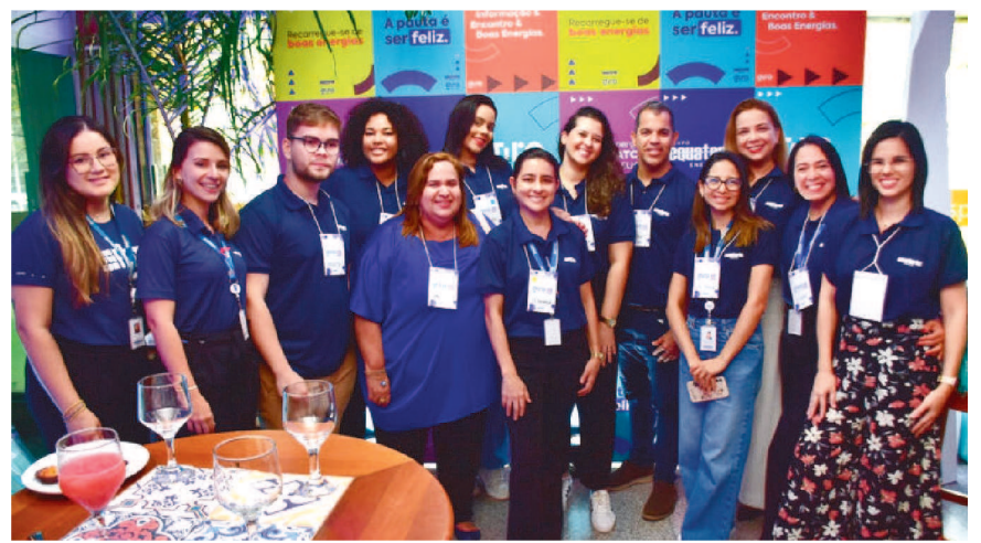
Equipe de Comunicação Externa da Equatorial Maranhão