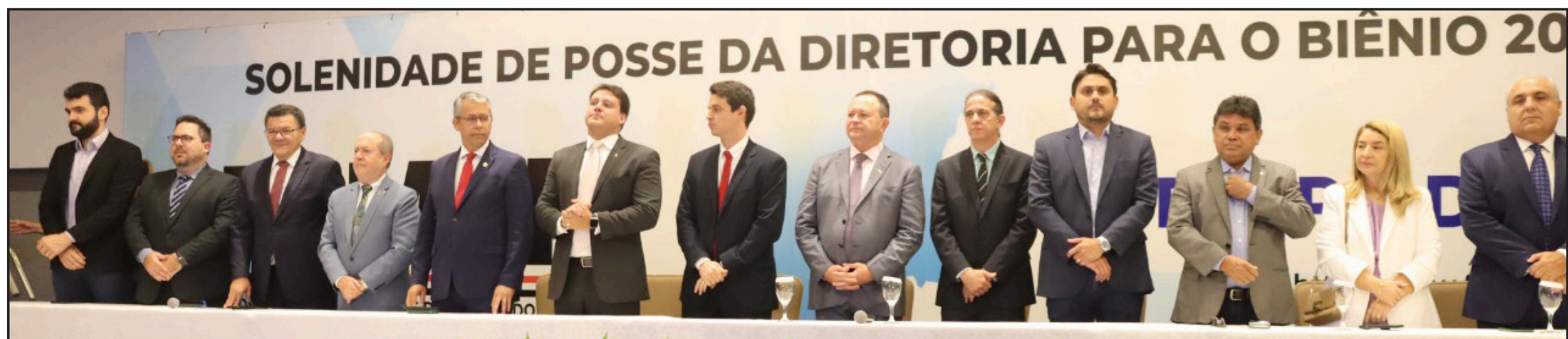
Governador Carlos Brandão participa da solenidade de posse da nova Mesa Diretora da Famem