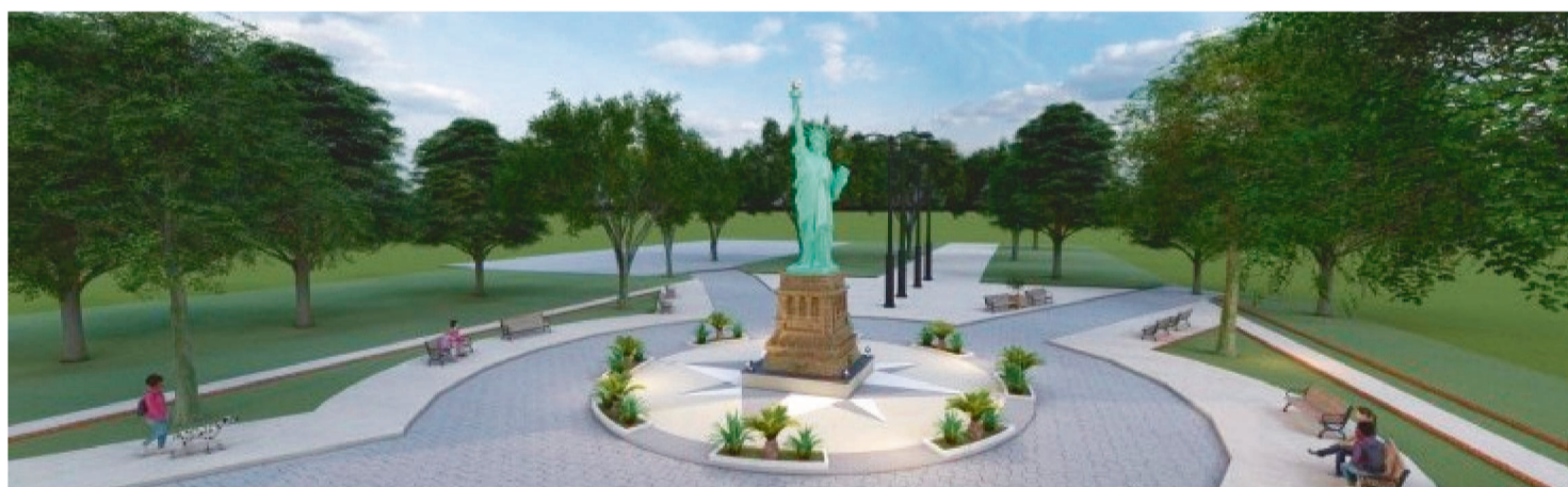
A CIDADE MARANHENSE DE NOVA IORQUE VAI GANHAR UMA ESTÁTUA DA LIBERDADE, MEDINDO 8,4 METROS DA BASE AO TOPO

A cidade maranhense de Nova Iorque vai ganhar um importante incentivo para o turismo: o governador Carlos Brandão assinou ordem de serviço autorizando a reforma da praça central da cidade e também a construção de uma réplica da estátua da Liberdade, medindo 8,4 metros da base ao topo. A ordem de serviço foi assinada na tarde desta segunda-feira (24) no Palácio dos Leões, no Centro, e a obra será coordenada pela Secretaria de Estado do Governo (Segov).