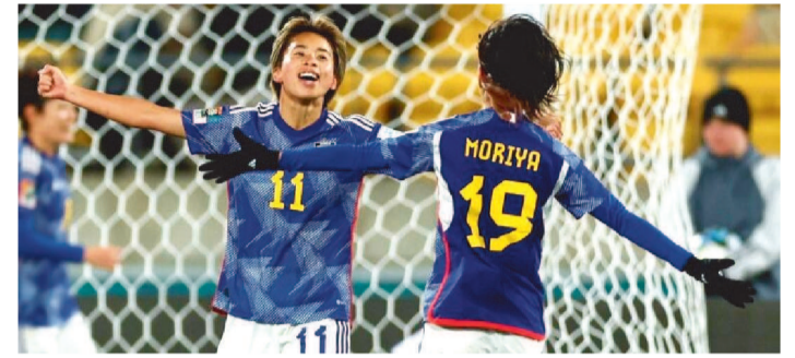
BRASIL PRECISA VENCER A JAMAICA AMANHÃ ÀS 7H

A Copa do Mundo feminina está chegando em seu momento mais decisivo. Em disputa, a terceira rodada da fase de grupos decide quem avança para as oitavas de final e quem já retorna para casa. Seis das 16 seleções que jogarão o mata-mata já finalizaram os três jogos iniciais e agora conhecem suas adversárias e chaveamento.