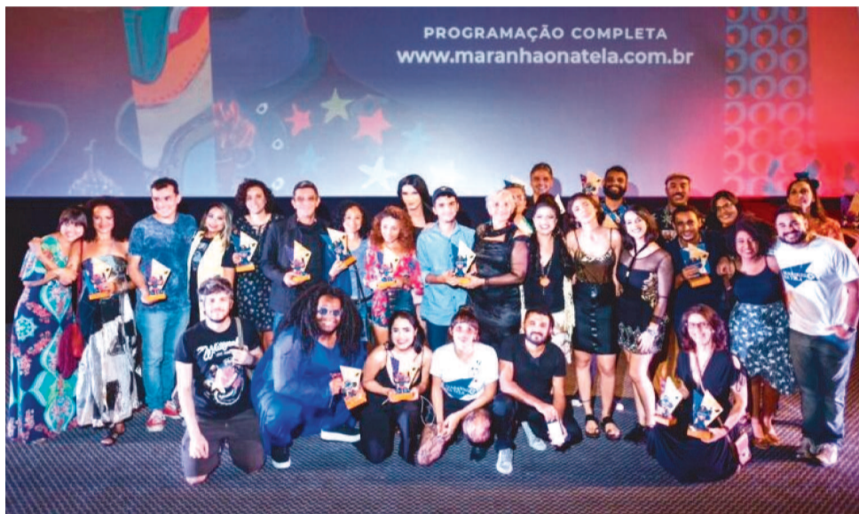
SERÃO CERCA DE 40 HORAS DEDICADAS À PRODUÇÃO AUDIOVISUAL MARANHENSE

exclusivamente a produção audiovisual maranhense, com a exibição de 67 obras, em 20 sessões, sendo 10 competitivas e 10 informativas. “Realizar uma mostra exclusiva de filmes maranhenses só foi possível em 2015,