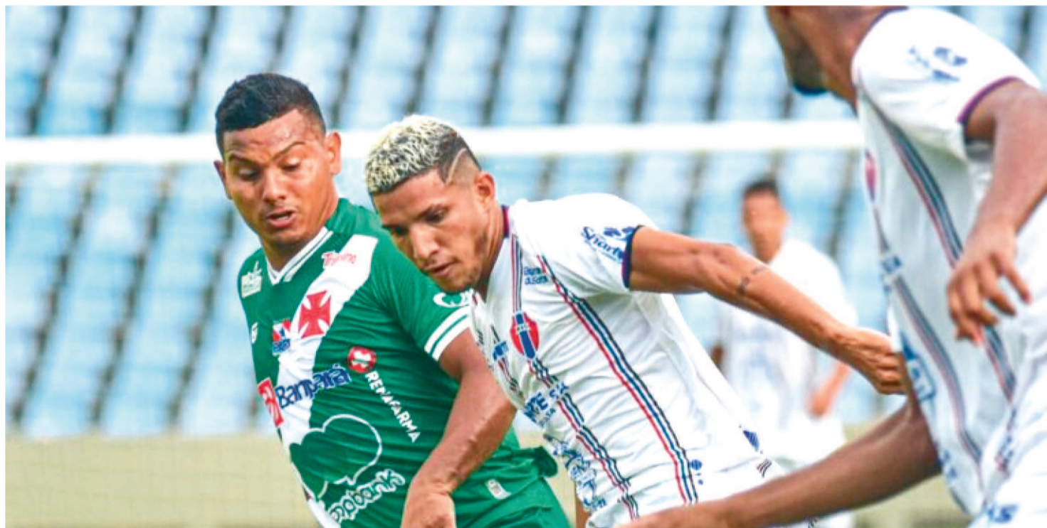
MARANHÃO ATLÉTICO CLUBE PROMETE DAR O TROCO À TUNA NO SEGUNDO JOGO MARCADO PARA ACONTECER EM BELÉM

Em desvantagem no mata-mata da segunda fase do Campeonato Brasileiro, depois da derrota para a Tuna Luso, em São Luís, no último sábado, o Maranhão Atlético Clube inicia a semana de treinamentos com vistas ao importante duelo do próximo fim de semana em Belém.