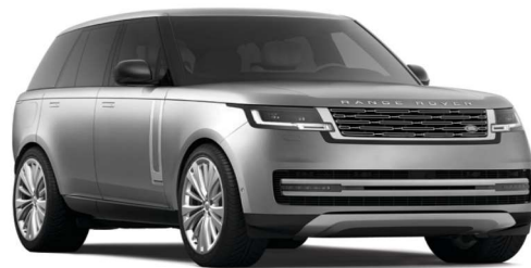
LAND ROVER RANGE ROVER SALKA9B70PA027488 A SALKA9BWXPA035251 (Chassis não sequenciais) Fabricados de 23 de setembro de 2020 a 29 de novembro de 2022

A Land Rover Brasil convoca os proprietários dos veículos Land Rover Range Rover, ano/modelo 2022/2023, chassis finais PA027488 a PA035251, fabricados de 23 de setembro de 2020 a 29 de novembro de 2022, a contatar um concessionário autorizado Land Rover para agendar o serviço gratuito de inspeção, e, se necessário, a substituição do conjunto dos faróis traseiros.