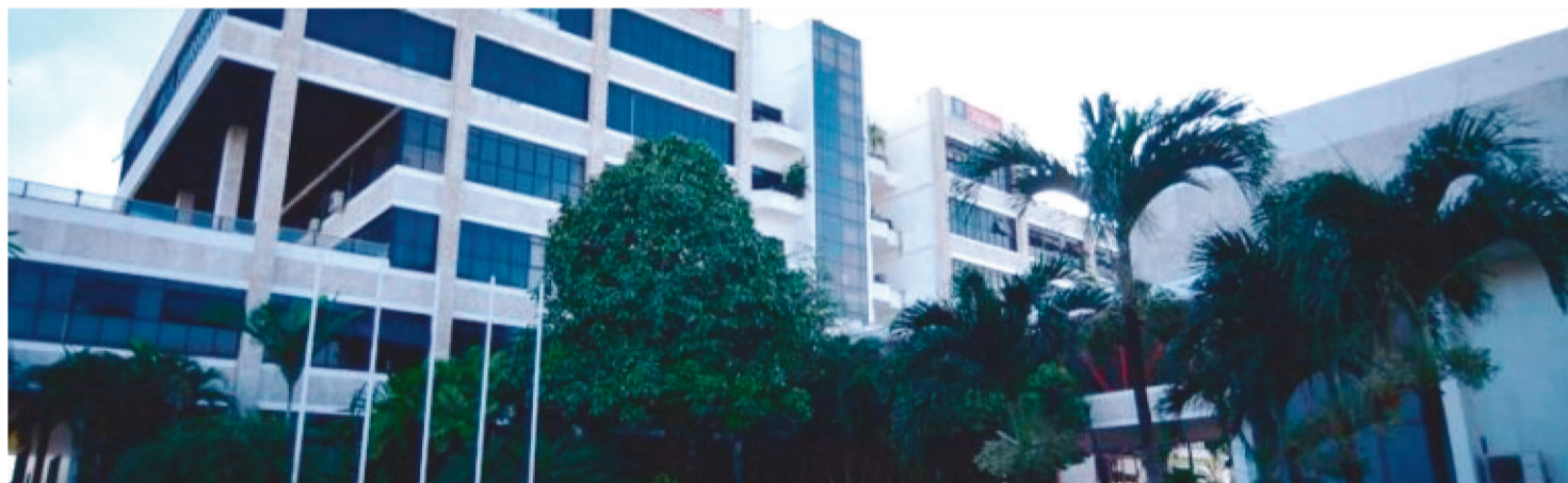
CASA DA INDÚSTRIA ALBANO FRANCO, SEDE DA FEDERAÇÃO DAS INDÚSTRIAS DO ESTADO DO MARANHÃO (FIEMA)

SÃO LUÍS – Em junho de 2023, o Índice de Confiança do Empresário Industrial do Maranhão (ICEI-MA) obteve uma variação positiva (0,2 pontos) alcançando 50,2 pontos e permanecendo dentro do grau de confiança do indicador, que se dá acima dos 50 pontos. O estudo é elaborado mensalmente pela Federação das Indústrias do Estado do Maranhão (FIEMA) em parceria com a Confederação Nacional da Indústria (CNI) junto às empresas industriais maranhenses e antecede o desempenho do setor, sinalizando as mudanças de tendência da produção industrial. Na pesquisa de junho, apesar do aumento no indicador, o ICEI se apresenta 11,2 pontos abaixo do registrado no mesmo mês do ano passado.