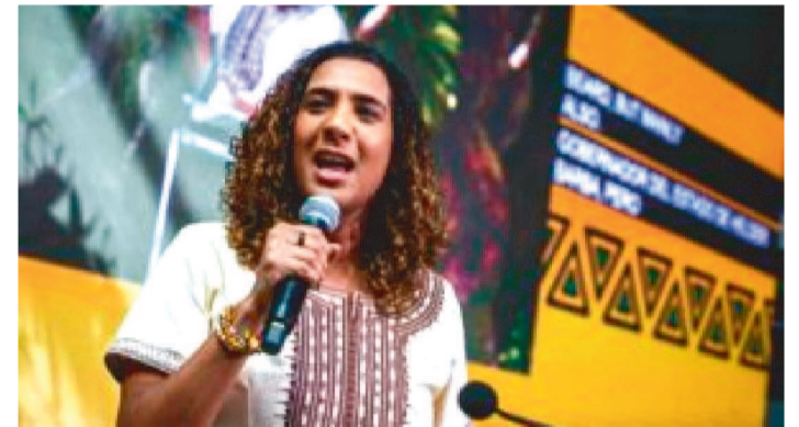
A ministra da igualdade racial, Anielle Franco, anuncia criação de Comitê de Monitoramento da Amazônia Negra e Enfrentamento ao Racismo Ambiental.

A ministra da Igualdade Racial, Anielle Franco, reafirmou nesta segunda-feira (7) que a meta do governo federal é regularizar ao menos 300 territórios quilombolas até o fim da atual gestão, em dezembro de 2026.