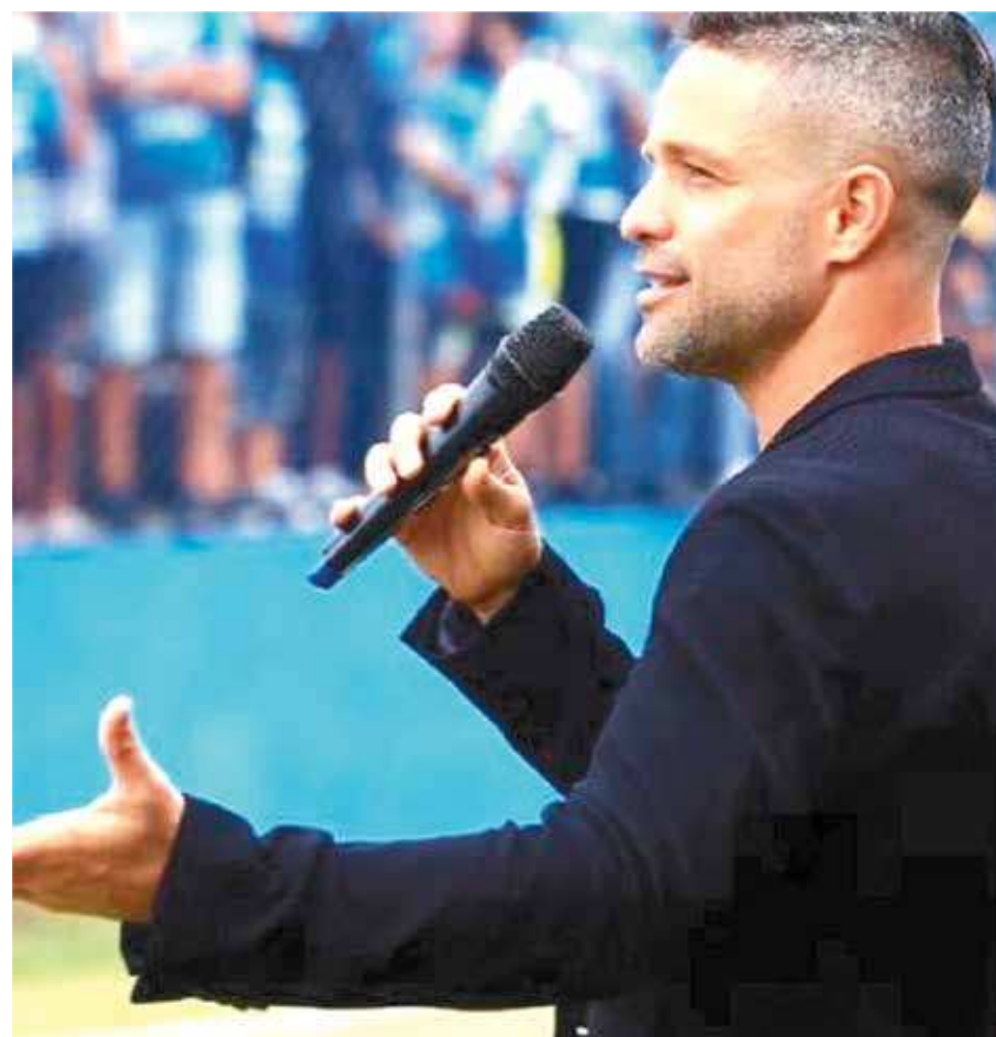
Diego Ribas, bicampeão da Copa Libertadores pelo Flamengo, está construindo uma nova carreira fora dos gramados como palestrante e gerador de conteúdo sobre empreendedorismo e liderança