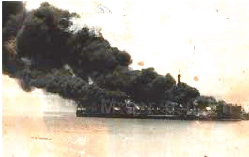
NAVIO MARIA CELESTE PEGOU FOGO NA BEIRA-MAR, NA CAPITAL MARANHENSE

Foi no dia 16 de março de 1954, quando o Maria Celeste, um navio de pequeno porte, pertencente à Companhia de Navegação, construído em 1944 incendiou durante a operação de desembarque de combustíveis. Foi consumido por três dias pelas chamadas