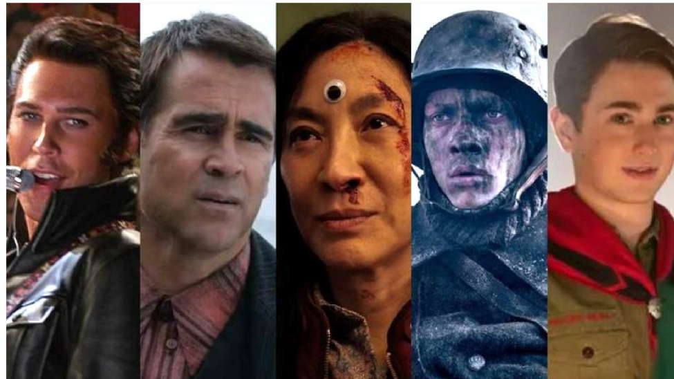
"TUDO EM TODO LUGAR AO MESMO TEMPO" É O FAVORITO AO PRÊMIO DE MELHOR FILME