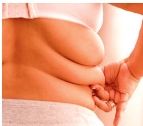
A projeção da Organização Mundi-

É possível acionar a Justiça pela ridicularização e inviabilização do corpo. No entanto, a pessoa ofendida terá que alegar que sofreu injúria e não gordofobia, já que a expressão ainda não é tipificada em lei.