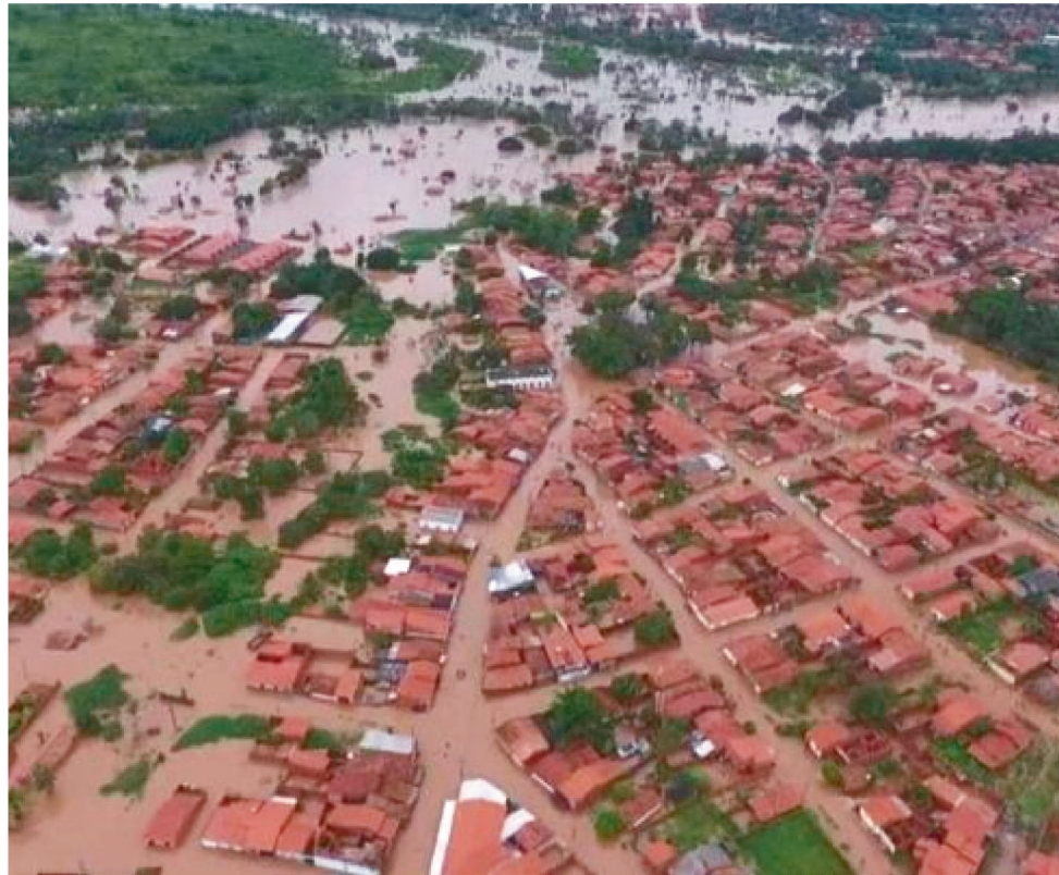
ENCHENTES NO MARANHÃO JÁ AFETARAM CERCA MILHARES DE MARANHENSES

Constam no decreto os municípios: Afonso Cunha, Alto Alegre do Pindaré, Barreirinhas, Buriti, Coroatá, Esperantinópolis, Governador Nunes Freire, Graça Aranha, Grajaú, Lago da Pedra, Pedreiras, Pinheiro, Poção de Pedras, Santa Inês, Santa Luzia, Santo Antônio dos Lopes, São João do Caru, Trizidela do Vale, Tuntum e Zé Doca.