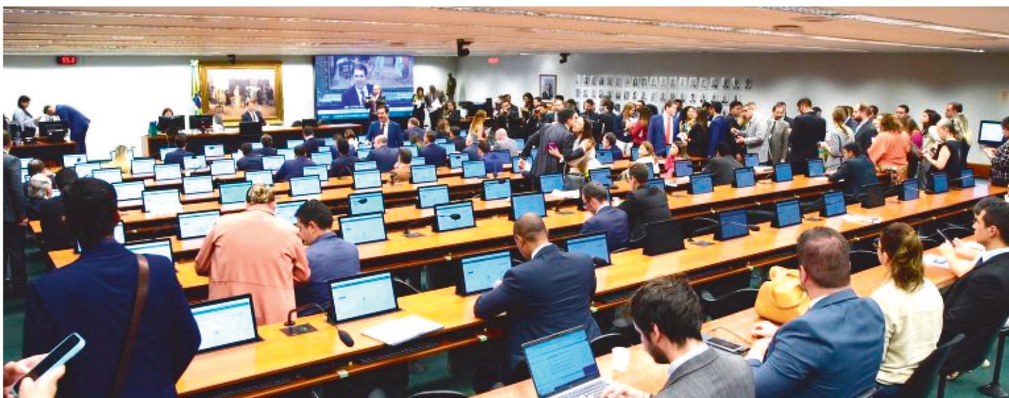
CÂMARA CRIOU CINCO COMISSÕES PERMANENTES E APENAS QUATRO AINDA VÃO MARCAR NOVA DATA PARA AS ELEIÇÕES

As comissões permanentes da Câmara dos Deputados elegeram nesta quarta-feira (15) seus presidentes, com mandato de um ano. Os partidos dos presidentes foram definidos previamente pelos líderes partidários. Neste ano, a Câmara criou cinco comissões permanentes por desmembramento das funções de outras já existentes.