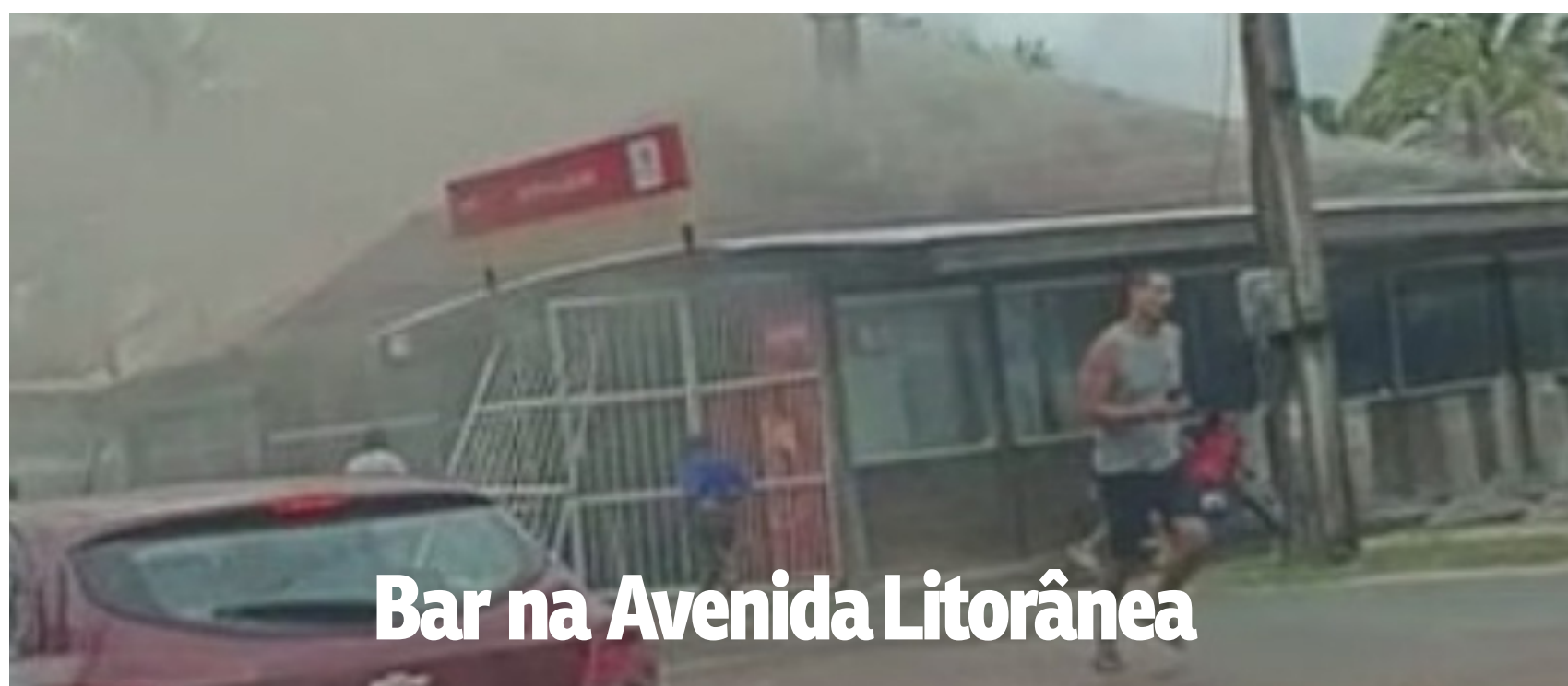
Bar na Avenida Litorânea

Alem das fortes chuvas o mês de março registrou incêndios na capital maranhense.