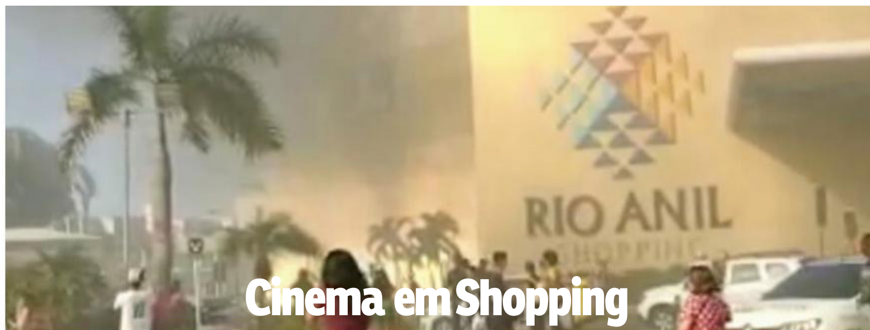
Cinema em Shopping

Um menos de 2 dias São Luís registrou um princípio de incêndio em um transporte coletivo no Terminal da Praia Grande, e outro em um estabelecimento na Avenida Litorânea. No início do mês, salas de cinema de um shopping pegaram fogo e duas pessoas morreram, além de deixar várias feridas.