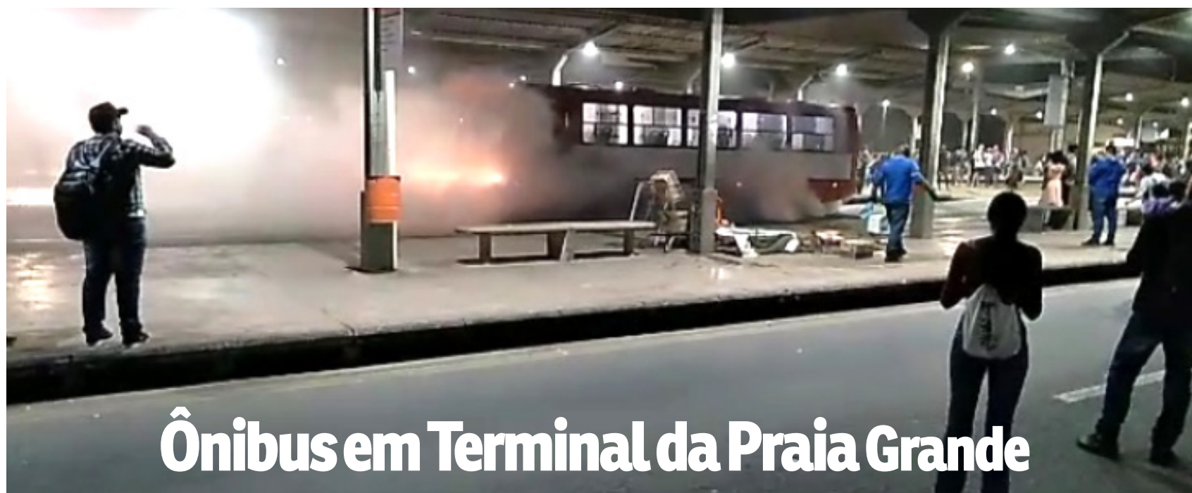
Ônibus em Terminal da Praia Grande