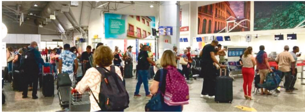
O AEROPORTO DE SÃO LUÍS DEVE TER MAIS DE 150 POUSOS E DECOLAGENS NO PERÍODO

Com mais de 150 pousos e decolagens nesse período, a CCR Aeroportos segue trabalhando para que todos os viajantes possam ter uma experiência satisfatória em SLZ. “Nessas datas em que o fluxo de passageiros é maior, re-