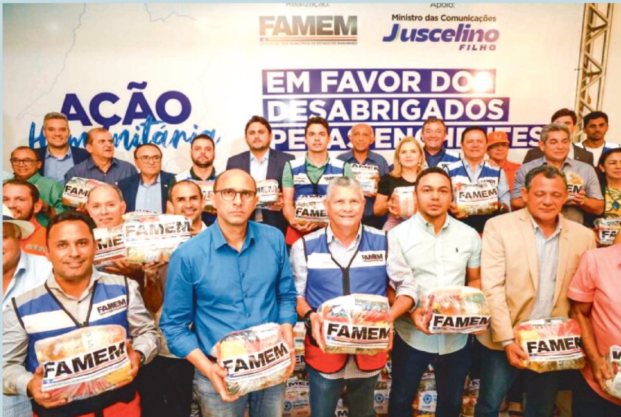
1. Cestas básicas foram entregues em municípios afetados pelas fortes chuvas no Maranhão

Presente na ação, o secretário-chefe da Casa Civil, Sebastião Madeira, enfatizou a importância da mobilização para o socorro aos municípios vulneráveis. “Desde que as chuvas mais fortes começaram, o governador Carlos Brandão criou um comê e colocou praticamente todo o governo trabalhando. O Governo do Estado não tem medido esforços para acudir a população”, elogiou.