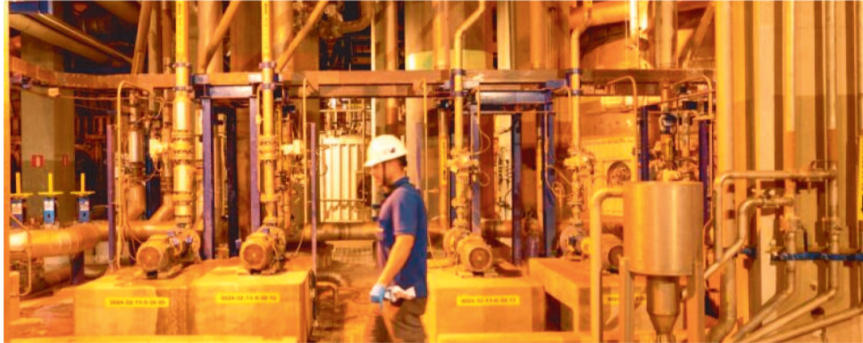
SEGUNDO LEVANTAMENTO, ÍNDICE DE MAIOR PREOCUPAÇÃO É O DA METALURGIA

De janeiro a agosto, os dados da Produção Industrial Mensal mostraram queda em todos os segmentos industriais. A indústria geral, a extrativa e a indústria de transformação registraram quedas de -3,6%, -9,5% e -2,6%, respectivamente. Esses resultados negativos têm relação com a redução no volume produtivo de alguns segmentos, como bebidas, minerais não metálicos e metalurgia, por