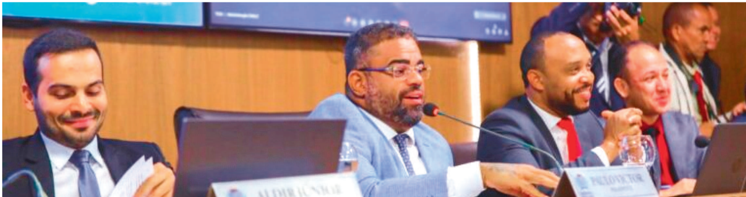
SETE PARLAMENTARES VOTARAM CONTRA MODIFICAÇÕES DA PROPOSTA ORIGINAL ENVIADA PELO PREFEITO EDUARDO BRAIDE