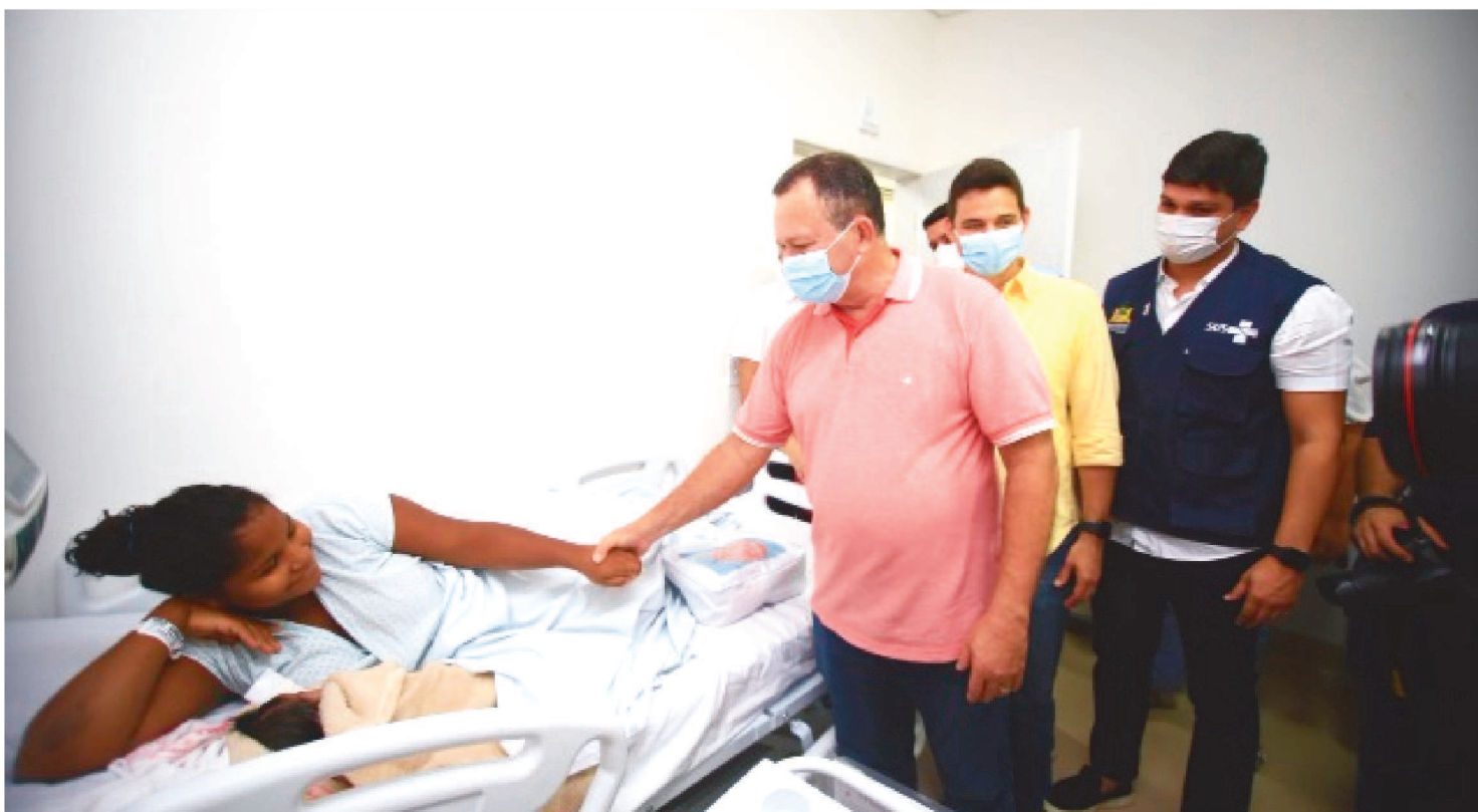
BRANDÃO DESTACOU QUE CONTINUARÁ TRABALHANDO EM PARCERIA COM OS MUNICÍPIOS E TAMBÉM COM O GOVERNO FEDERAL

Durante a sessão solene de posse, realizada no domingo (1º), na Assembleia Legislativa, o governador Carlos Brandão e o vice-governador Felipe Camarão reafirmaram o compromisso com a saúde dos maranhenses.