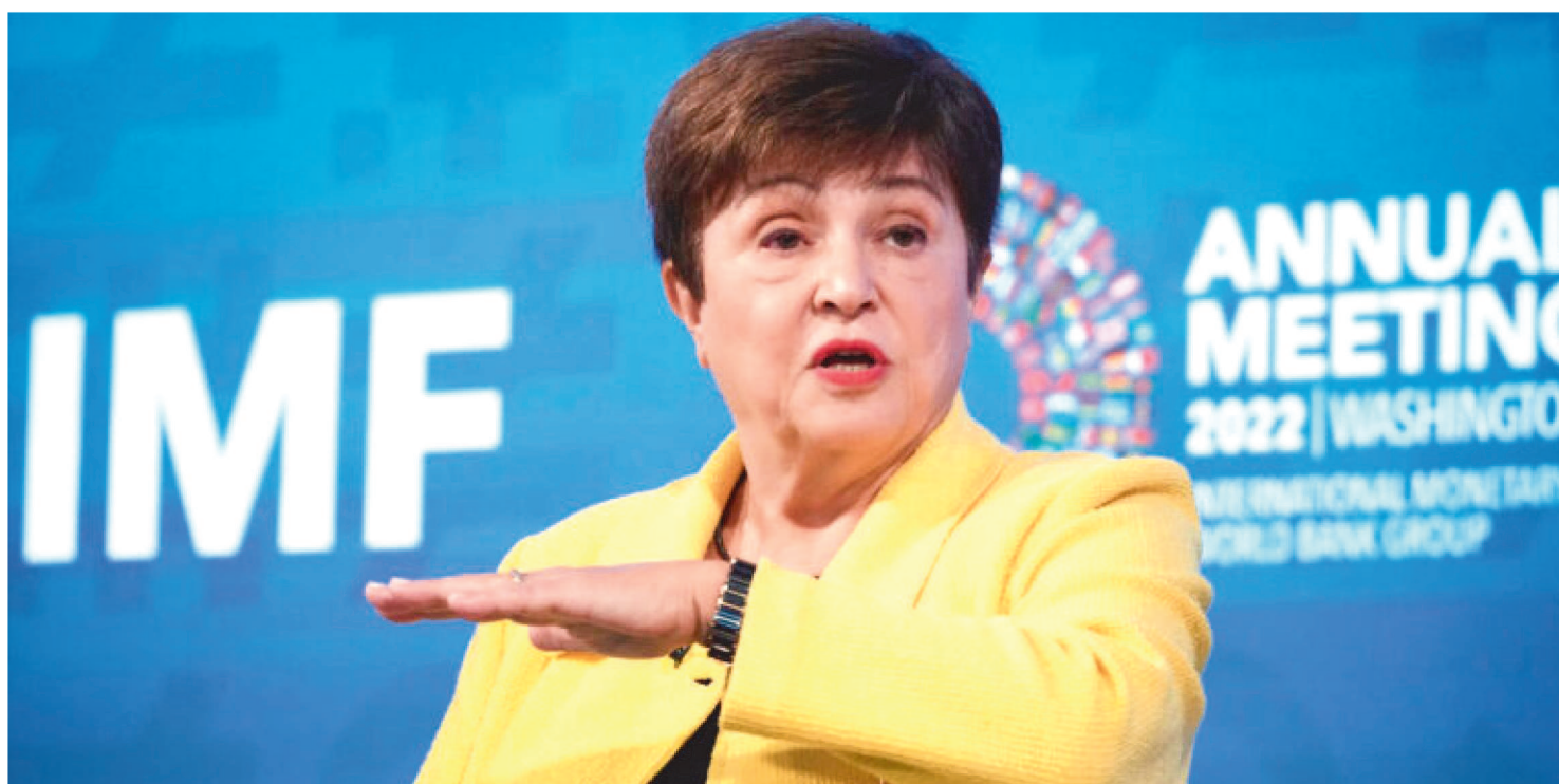
KRISTALINA GEORGIEVA EXPLICA QUE AS TRÊS GRANDES ECONOMIAS, EUA, UE E CHINA, ESTÃO DESACELERANDO SIMULTANEAMENTE

Este ano será mais difícil para a economia global do que aquele que deixamos para trás, alertou a chefe do Fundo Monetário Internacional (FMI), Kristalina Georgieva.