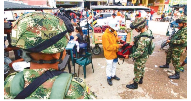
VENEZUELA E COLÔMBIA SE REAPROXIMARAM APÓS ELEIÇÕES

Em mais uma etapa de normalização das relações bilaterais, Venezuela e Colômbia completaram, ontem, a reabertura da fronteira com a inauguração da ponte de Tienditas, rebatizada de Atanasio Girardot. A obra, que liga as cidades de Ureña (estado de Táchira, na Venezuela) e Cúcuta (departamento de Norte de Santander), é simbólica. Construída em 2016, a ponte nem chegou a ser inaugurada e foi bloqueada por gigantescos contêineres metálicos instalados por militares venezuelanos como uma barricada, depois que os dois países romperam, em 2019.