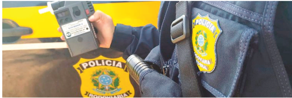
29 INFRAÇÕES REGISTRADA PELA PRF NO PERÍODO FORAM POR ALCOOLEMIA

Na operação passada, foram 13 autuações por alcoolemia, 82 pelo não uso de capacete, 23 pelo não uso de cinto de segurança, 29 por ultrapassa-