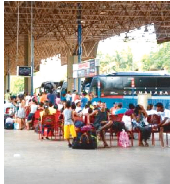
A MÉDIA FOI DE TRÊS MIL PASSAGEIROS EMBARCADOS POR DIA

A SINART, empresa que administra terminais rodoviários, revelou em relatório que em dezembro de 2022, alta temporada, no Terminal Rodoviário de São Luís a movimentação superou as expectativas. Foram mais de 90 mil passageiros embarcados durante todo o mês, uma média de três mil passageiros por dia. O aumento de movimentação registrado foi 40% maior se comparado a 2021.