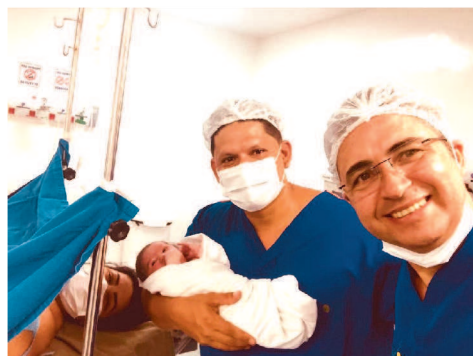
Parabéns aos novos pais e que Deus abençoe suas crianças.