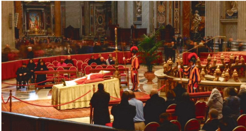
CORPO DE BENTO XVI ESTÁ EM FRENTE AO ALTAR PRINCIPAL DA BASÍLICA DE SÃO PEDRO

Antes da abertura da capela funerária da basílica, uma liturgia privada foi celebrada com os cardeais e as pessoas mais próximas do pontífice. Autoridades também estiveram presentes, como a primeira-ministra italiana, Giorgia Meloni.