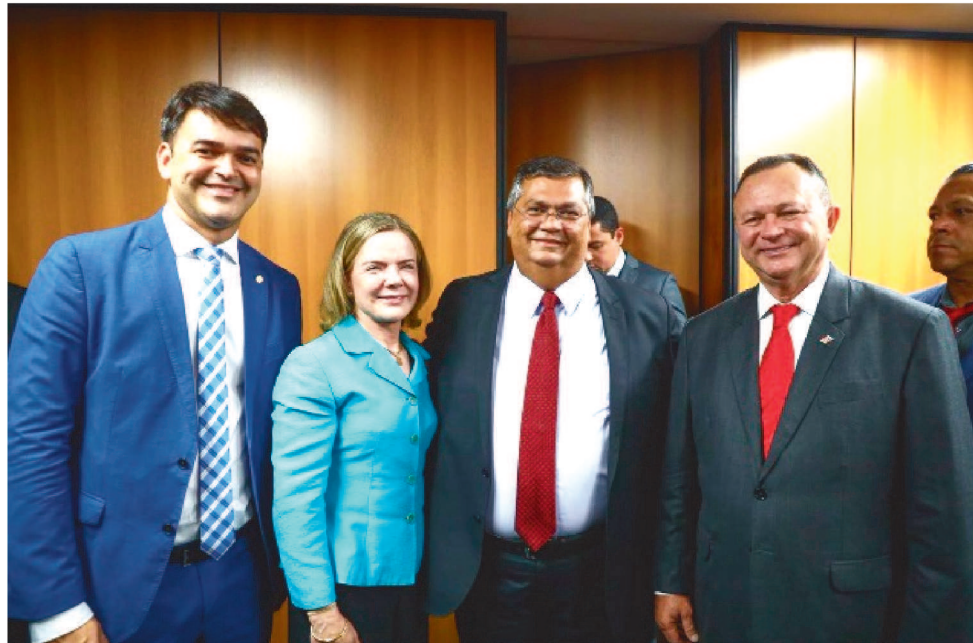
FLÁVIO DINO TOMOU POSSE COMO MINISTRO DA JUSTIÇA E SEGURANÇA PÚBLICA

sigualdades, o Ministério da Segurança Pública é de todos e de todas, mas é, sobretudo, daqueles que lutam por uma justiça antirracista, contra o feminicídio, que lutam pela proteção da comunidade LGBTQIA+, daqueles que são contra todas as formas de preconceito e de violência. Aqui, por ser uma casa devotada à Justiça, é a dos mais pobres, dos invisibilizados, esquecidos, discriminados e dos que menos têm”, frisou o ministro Flávio Dino.