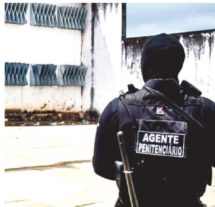
AS VAGAS SÃO PARA TRABALHAR EM UNIDADES PRISIONAIS

A Secretaria de Estado de Administração Penitenciária do Maranhão (SEAP) informa que as inscrições do Processo Seletivo, que tem como objetivo de formar cadastro reserva no cargo de Auxiliar Penitenciário Temporário masculino, encerram hoje, terça-feira, dia 3 de janeiro.