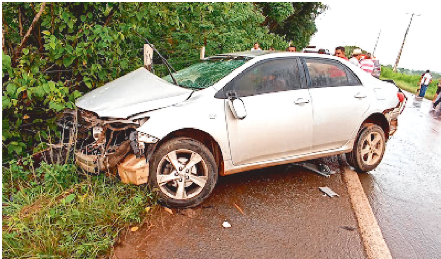
O CONDUTOR DO TOYOTA COROLLA FICOU GRAVEMENTE FERIDO, ASSIM COMO OS PASSAGEIROS QUE ESTAVAM NO RENAULT DUSTER

Um grave acidente deixou sete pessoas feridas, na BR-226, logo nas primeiras horas da manhã desta segunda-feira, dia 2 de janeiro de 2023. De acordo com informações, um veículo Renault Duster e um Toyota Corolla colidiram frontalmente, próximo a cidade de Presidente Dutra. De acordo com relatos de testemunhas, o Renault Duster estava saindo da cidade de Presidente Dutra, com destino a cidade de Marabá, no Pará. Enquanto o outro veículo entrava no município.