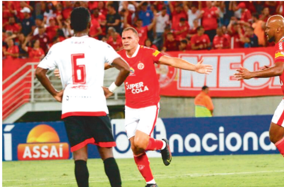
O MOTO FOI ELIMINADO DO PRÉ-NORDESTÃO APÓS GOLEADA DIANTE O AMÉRICA-RN