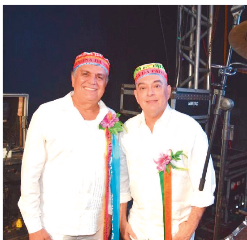
A Companhia Barrica/Bicho Terra encenou o espetáculo Natalina da Paixão.