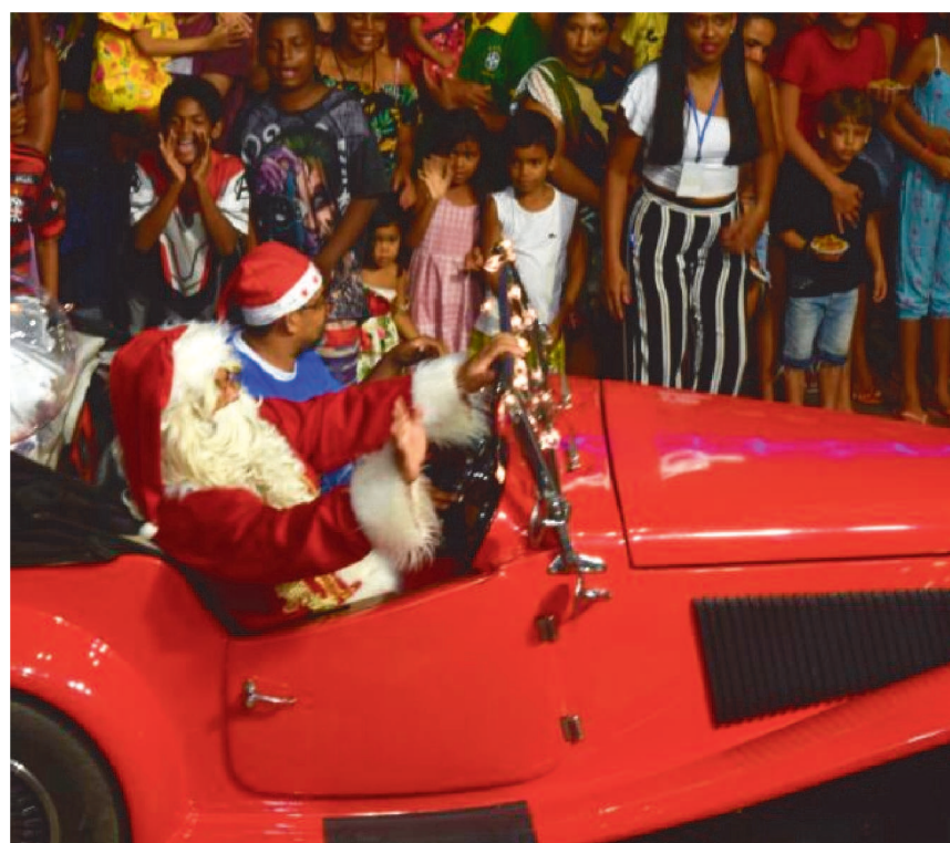
Papai Noel acenando para a multidão