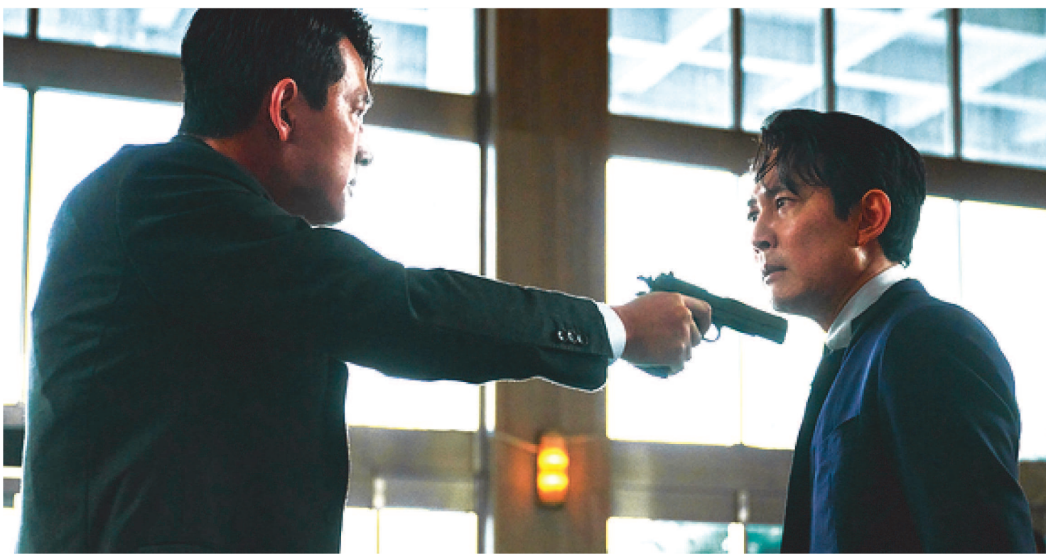
O FILME TAMBÉM TEM DIREÇÃO E ROTEIRO ASSINADOS POR JUNG-JAE, QUE VENCEU O EMMY DE MELHOR ATOR EM SÉRIE DRAMÁTICA

Estrelado por Lee Jung-jae (“Round 6”), o longa “Operação Hunt” (“Hunt”) chega em 2 de fevereiro nos cinemas do país. Distribuído pela Synapse Distribution no Brasil e em toda a América Latina, o filme também tem direção e roteiro assinados por Jung-jae, que venceu o Emmy de Melhor Ator em Série Dramática em 2022. Confira o trailer aqui e veja as imagens neste link.