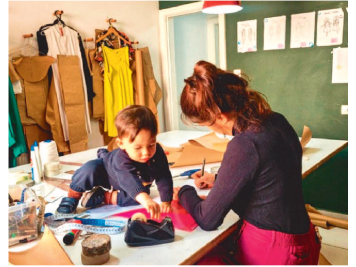
O CURSO SERÁ REALIZADO DE 17 A 28 DE JANEIRO EM SÃO LUÍS

Ensinar modelagem de modo orgânico, a partir do corpo de cada um, resultando em peças cheias de personalidade é um dos principais objetivos do curso Descomplicando a modelagem. A parceria entre o CCVM e a renomada estilista Rita Comparato realizada em 2021 agora terá a sua versão presencial.