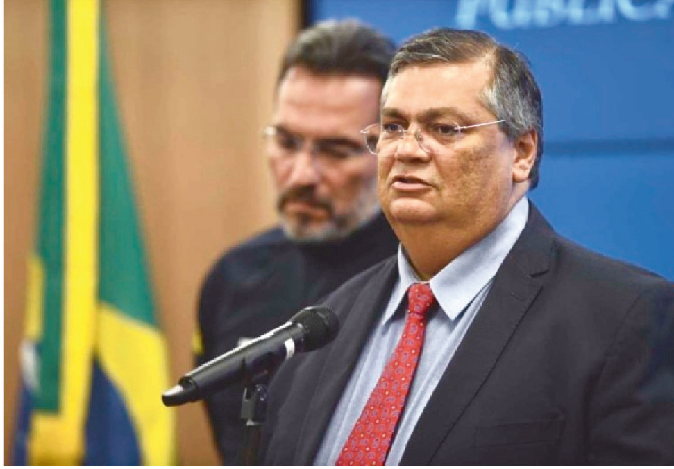
DINO AFIRMOU QUE A PF JÁ REALIZOU A PERÍCIA NOS PRÉDIOS-SEDE DOS TRÊS PODERES

Dino também afirmou que a PF já realizou a perícia nos prédios-sede dos Três Poderes.