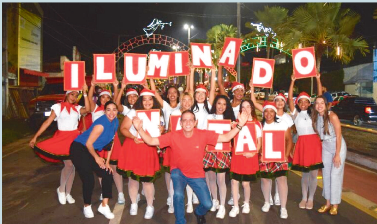
O Desfile de Natal animou a Avenida Alexandre Costa em Caxias