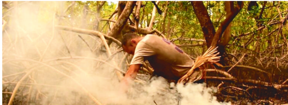
O CURTA “AMARRADO” SERÁ EXIBIDO DIA 14 NO CENTRO CULTURAL VALE MARANHÃO

O nome do evento faz alusão à definição dada às populações que habitam a região mesopotâmica entre os rios Parnaíba e Poti, fronteiras entre Piauí e Maranhão (Pi-ranhão) e a Mostra propõe um fortalecimento da cultura audiovisual e cinematográfica nos dois estados. “O cinema tem o poder de promover intercâmbios culturais e a Mostra Piranhão reflete essa