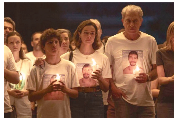
A TRAMA É BASEADA NO LIVRO “TODO DIA A MESMA NOITE”

“Memória não morrerá”, canta Milton Nascimento na canção Sentinela, que marca a trilha sonora do trailer de Todo dia a Mesma noite, divulgado nesta segunda-feira (9/1). A minissérie brasileira de ficção inspirada na história real do incêndio na boate Kiss, que tirou a vida de 242 jovens em Santa Maria, Rio Grande do Sul, em 2013, estreia na Netflix no dia 25 de janeiro.