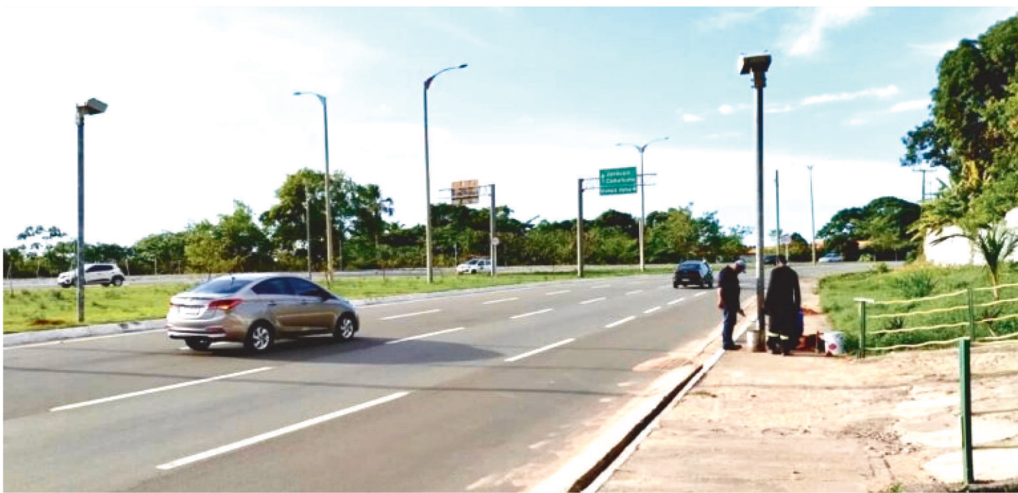
APÓS A INSTALAÇÃO, PREVISTO PARA O DIA 13 DE JANEIRO, O EQUIPAMENTO VAI FUNCIONAR EM PERÍODO DE TESTE POR 30 DIAS

A Prefeitura de São Luís, por meio da Secretaria Municipal de Trânsito e Transportes (SMTT) iniciou, no último fim de semana, os serviços de implantação dos equipamentos de fiscalização eletrônica na Via Expressa.