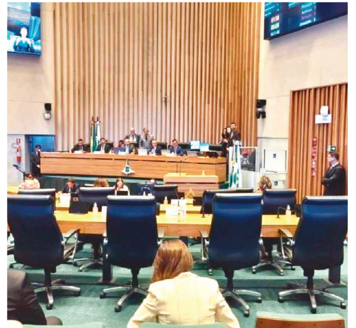
PARLAMENTARES REALIZARAM SESSÃO EXTRAORDINÁRIA

Durante a sessão extraordinária da Câmara Legislativa do Distrito Federal (CLDF), na tarde desta segunda-feira (9/1), os deputados distritais concordaram na criação de uma Comissão Parlamentar de Inquérito (CPI) para investigar os atos antidemocráticos ocorridos na cidade.