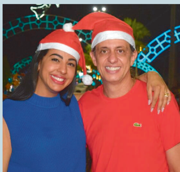
O prefeito Fabio Gentil e a deputada Daniella em clima natalino.