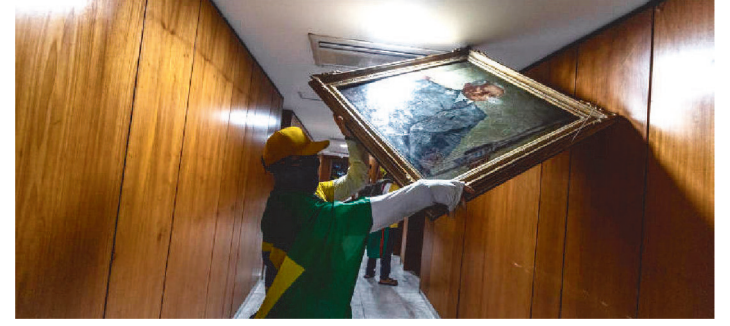
UMA RELAÇÃO PRELIMINAR DETALHA OBRAS VANDALIZADAS

No dia seguinte à depredação das sedes dos Três Poderes por terroristas, o governo convocou restauradores de obras de arte de todo o país para recuperar itens danificados. Nesta tarde, o Ministério da Cultura faz uma reunião para requisitar servidores do Instituto do Patrimônio Histórico e Artístico Nacional (Iphan) e do Instituto Brasileiro de Museus (Ibram) com conhecimento em restauração.