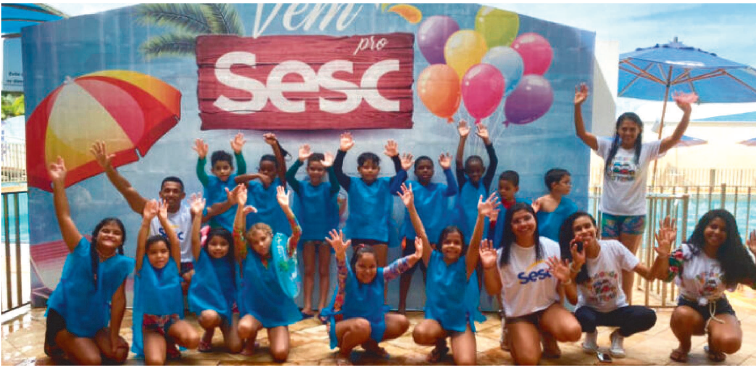
COM UM TOTAL DE 200 VAGAS PARA CRIANÇAS DE 6 A 10 ANOS, AS INSCRIÇÕES PARA A COLÔNIA DE FÉRIAS VÃO DE 11 A 18 DE JANEIRO

A tradicional Colônia de Férias do Sesc promete fazer a alegria da criançada no finalzinho. Realizada de 19 a 21 de janeiro em São Luís, no roteiro uma variada programação que propiciará momentos de muita alegria, diversão e também aprendizado.