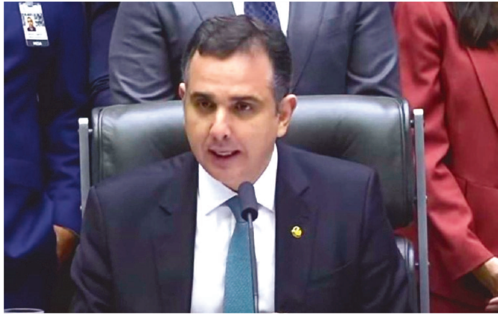
PRESIDENTE DA CASA, PACHECO DISSE QUE VÂNDALOS SÃO “MINORIA GOLPISTA”

dora Simone Tebet (MDB-MS), lamentou a depreciação da Casa Maior e mencionou a destruição de um quadro com a imagem de seu pai, o ex-presidente do Senado, Ramez Tebet. A ministra reforçou o discurso de que a democracia venceu a barbárie.