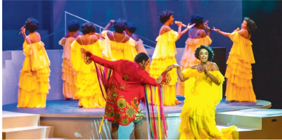
O MUSICAL É CONDUZIDO POR CAZUMBÁ, PERSONAGEM CENTRAL DO BUMBA MEU BOI

Em cartaz na Cidade das Artes Bibi Ferreira, na Barra da Tijuca, no Rio de Janeiro, o espetáculo se prepara para uma nova e longa temporada.