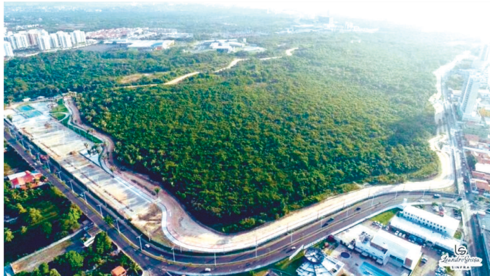
O PARQUE DO RANGEDOR ATRAI MUITAS PESSOAS DEVIDO À SUA ESTRUTURA E BELEZA