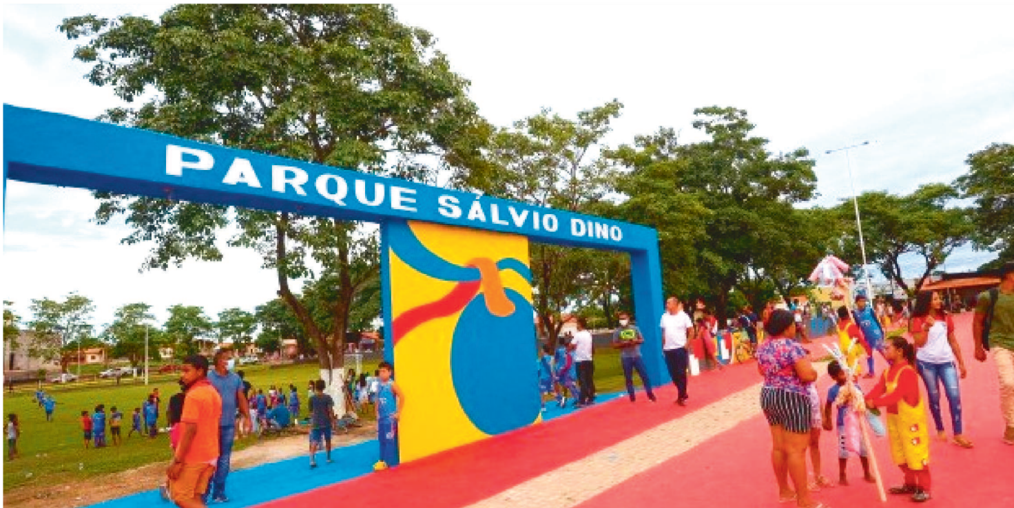
O PARQUE SÁLVIO DINO, EM JOÃO LISBOA, CONTA COM QUADRA POLIESPORTIVA, CAMPO DE FUTEBOL, ARENINHA, PLAYGROUD

Nos municípios do interior do estado os parques ambientais também são opção de lazer. Localizado em uma área de 8 mil metros quadrados, o Parque de Caxias oferece uma estrutura completa de esporte e lazer para a comunidade. O investimento de R$ 7 milhões viabilizou a execução de academia ao ar livre, pista de caminhada, playground, fonte luminosa, quadra poliesportiva e ampla área verde.