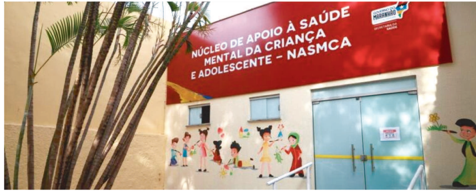
EM 2 ANOS DE FUNCIONAMENTO, SERVIÇO JÁ REALIZOU MAIS DE 17 MIL ATENDIMENTOS

“Quando ele tinha dois anos, comecei a notar algumas diferenças dele para as outras crianças. Ele não falava, não fazia contato visual e quando o