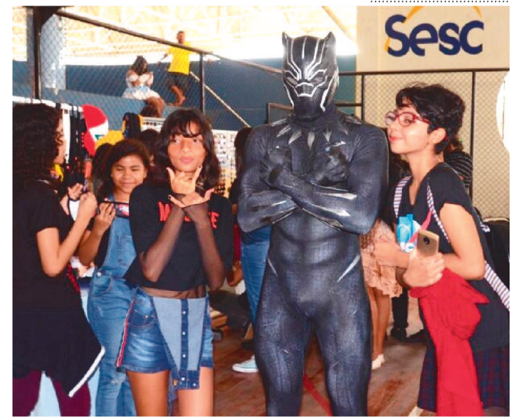
O EVENTO ACONTECE NO DIA 21 DE JANEIRO NO SESC DEODORO

Amantes do universo nerd, geek e da cultura pop! Já podem iniciar a contagem regressiva para a primeira edição do Sesc Geek em 2023. O evento é gratuito, aberto ao público, e acontece no dia 21 de janeiro, das 13h30 às 18h, no Sesc Deodoro.