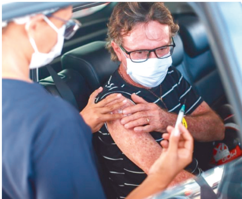
A AÇÃO FAZ PARTE DA CAMPANHA VACINA PARA TODOS, E SE ESTENDERÁ ATÉ SEXTA (28)

A imunização contra influenza é destinada, prioritariamente, a crianças de seis meses a menores de seis anos, gestantes, puérperas, pessoas com comorbidades, pessoas acima de 60 anos, população privada de liberdade, professores, pessoas com deficiência, caminhoneiros, trabalhadores rodoviários e portuários, adolescente em medida socioeducativa, além de servidores da segurança.