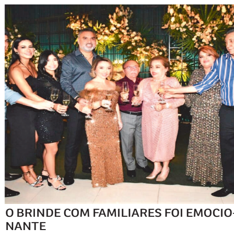
O BRINDE COM FAMILIARES FOI EMOCIONANTE