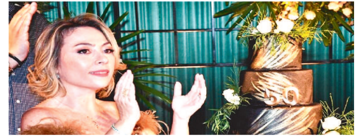
O PARABÊNS A VOCÊ FOI RECHEADO DE BOAS RECORDAÇÕES