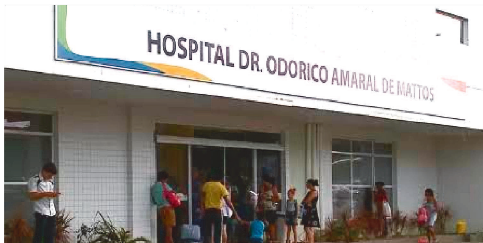
O BEBÊ MORREU NA UPA DO ARAÇAGI, PARA ONDE FOI APÓS TER ATENDIMENTO NEGADO

A família de etnia Ka'apor, território de povos tradicionais na região de Nova Olinda do Maranhão, já recebeu o corpo do bebê. A real causa da