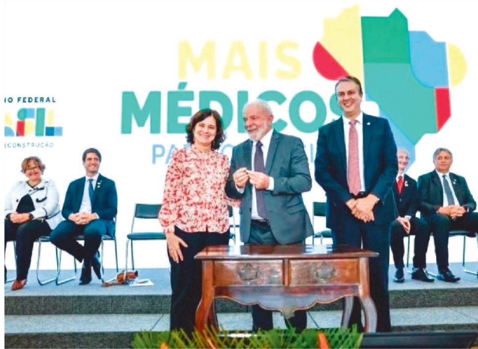
TEXTO DEVE SER VOTADO EM 120 DIAS APÓS ASSINATURA PARA CONTINUAR EM VIGOR

assinatura, mas precisa ser aprovada pelo Congresso, por meio da Comissão Mista, em até 120 dias para continuar em vigor.