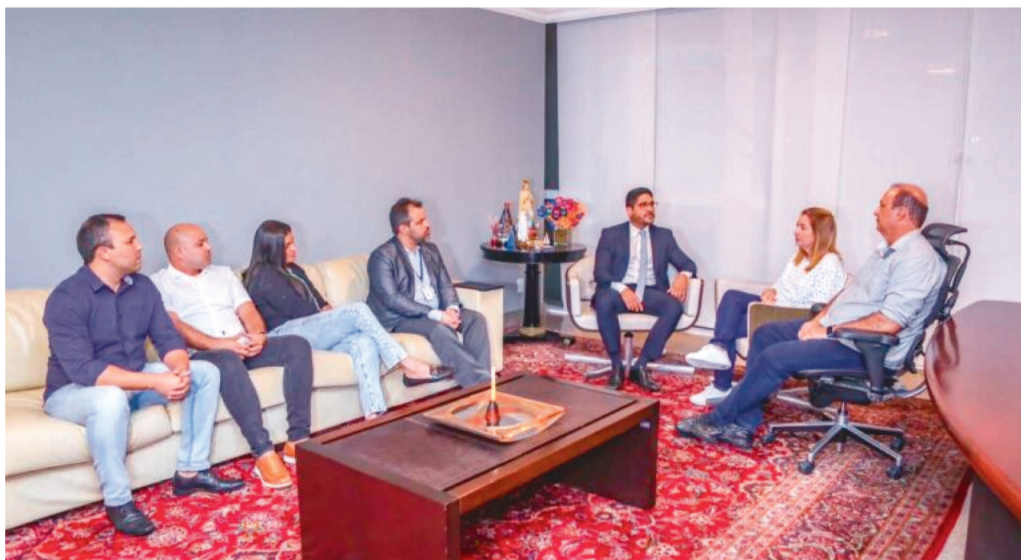
PRESIDENTE DA ALEMA, IRACEMA VALE, SECRETÁRIO DE MEIO AMBIENTE, PEDRO CHAGAS, E DEMAIS AUTORIDADES EM REUNIÃO

A presidente da Assembleia Legislativa do Maranhão, deputada Iracema Vale (PSB), reuniu-se, na tarde de terça-feira (9), com o secretário de Estado do Meio Ambiente e Recursos Naturais, Pedro Chagas, para assinar o termo de implantação do programa ‘Papel Zero’ no Parlamento Estadual, que busca promover o uso de processos e documentos por meios eletrônicos.