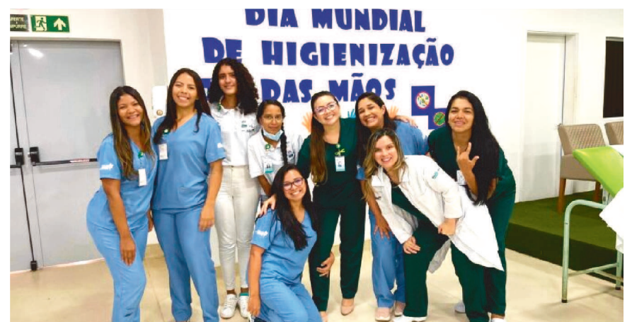
Parte do time do HSE que participou do evento alusivo ao Dia Mundial de Higienização das Mãos