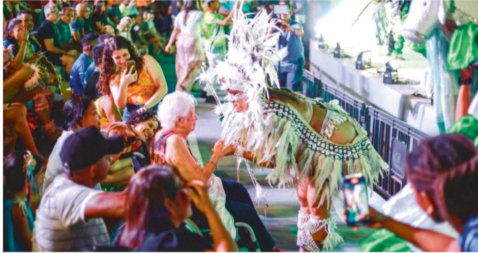
O MARANHÃO DE REENCONTROS É UMA PRÉVIA PARA O SÃO JOÃO DO MARANHÃO