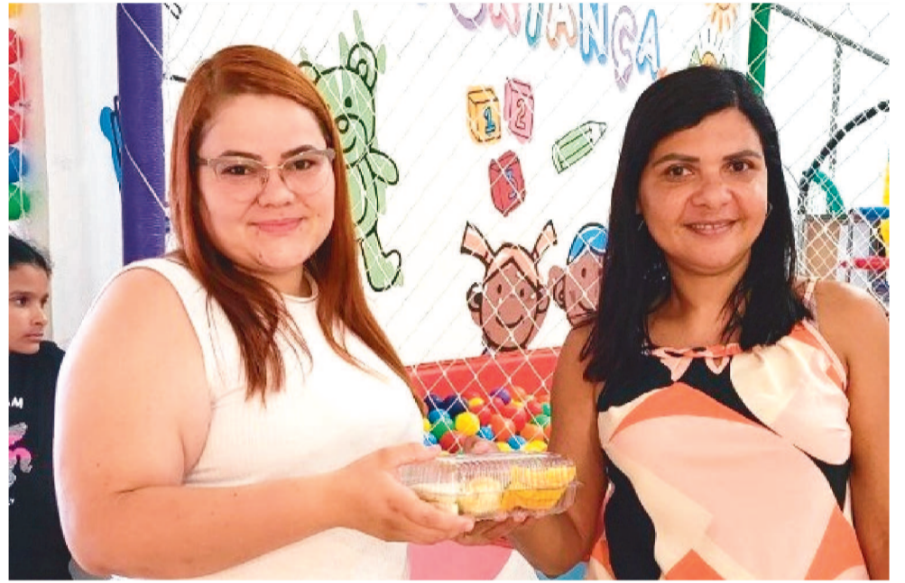
NO SHOPPING DA CRIANÇA DE SÃO LUÍS O INÍCIO DA AÇÃO DE HOMENAGEM SERÁ ÀS 8H

Em São Luís, as ações seguirão nos dias 20 (sábado) e 26 (sexta-feira), incluindo serviços de saúde, odontologia, estética, oficinas de culinária, dança, entre outros.