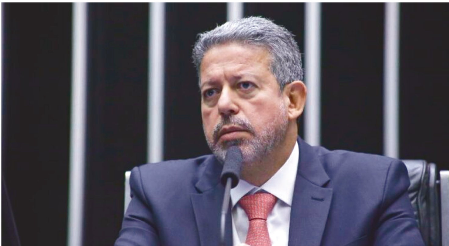
ARTHUR LIRA AFIRMOU QUE TRABALHO NO PLENÁRIO DA CÂMARA NÃO SERÁ “CONTAMINADO” POR COMISSÕES DE INQUÉRITO

Arthur Lira (PP-AL) confirmou, nesta segunda-feira (15/5), que devem ser instaladas nesta semana, provavelmente na quarta (17), três Comissões Parlamentares de Inquérito (CPI) criadas no fim de abril: a que investigará a manipulação de resultados de partidas de futebol; a da fraude nas lojas Americanas e a do Movimento dos Trabalhadores Rurais sem Terra (MST).