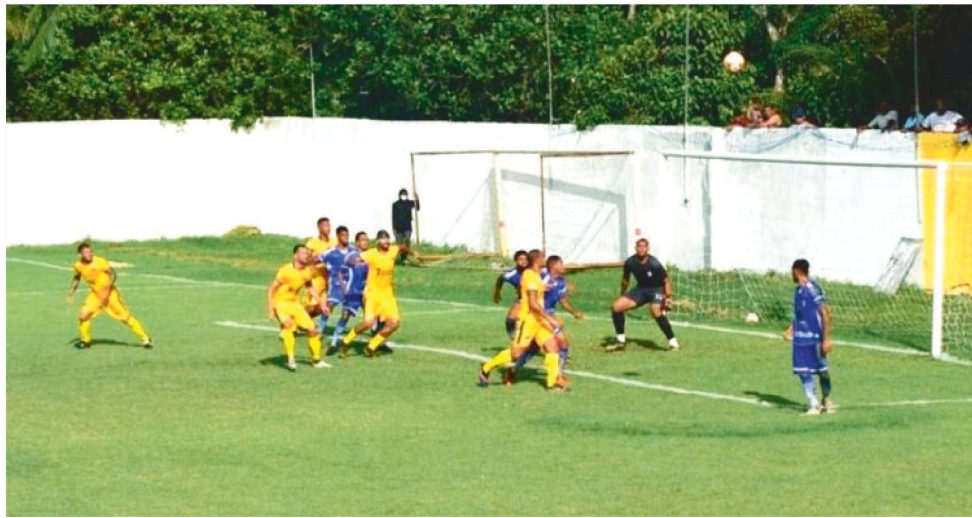
EM 2021, JOGO ENTRE BACABAL E SÃO JOSÉ TEVE INDÍCIOS DE MANIPULAÇÃO