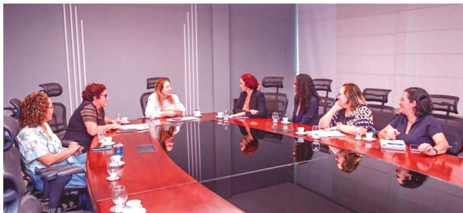
IRACEMA AFIRMOU QUE ESSES PROFISSIONAIS TÊM GRANDES CONTRIBUIÇÕES NA EDUCAÇÃO E QUE A LEI É RESULTADO ANOS DE LUTA

A presidente da Assembleia Legislativa do Maranhão, deputada Iracema Vale (PSB), reuniu-se com representantes do Sindicato dos Assistentes Sociais do Estado Maranhão (Sasema) para discutir acerca da Lei nº 13.935/2019, que garante a presença de profissionais da Psicologia e do Serviço Social na rede pública de educação básica.