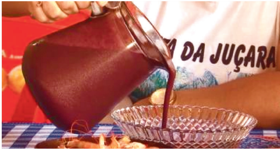
A IDEIA É DAR INÍCIO MAIS Cedo AO CALENDÁRIO ANUAL DE ATIVIDADES NO LOCAL

Um projeto do Governo do Maranhão, por meio da Agência Executiva Metropolitana (Agem), está possibilitando que os permissionários do Parque da Juçara, no Maracanã, possam iniciar as atividades no espaço antes do tradicional período da Festa da Juçara.