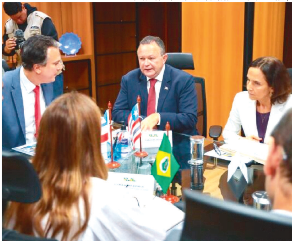
BRANDÃO RESSALTOU IMPORTÂNCIA DO APOIO DOS GOVERNADORES NA ARTICULAÇÃO

O pacto nacional envolverá a União, estados, Distrito Federal e municípios, visando concluir as obras e os serviços de engenharia em aproximadamente 3,5 mil escolas que atualmente encontram-se paralisadas ou inacabadas.