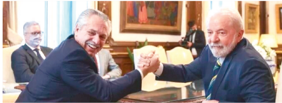
FATOR RELEVANTE DA CÚPULA É A DIVERSIDADE IDEOLÓGICA DOS PRESIDENTES

O primeiro a chegar à capital brasileira foi o presidente da Venezuela, Nicolás Maduro, na noite de domingo. Por causa da presença de tantos chefes de Estado, a Polícia Federal pediu reforço à PM do DF na segurança de