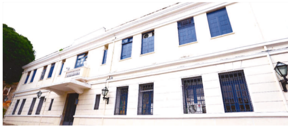
O PROJETO DE REAJUSTE FOI APROVADO EM REGIME DE URGÊNCIA PELA CÂMARA