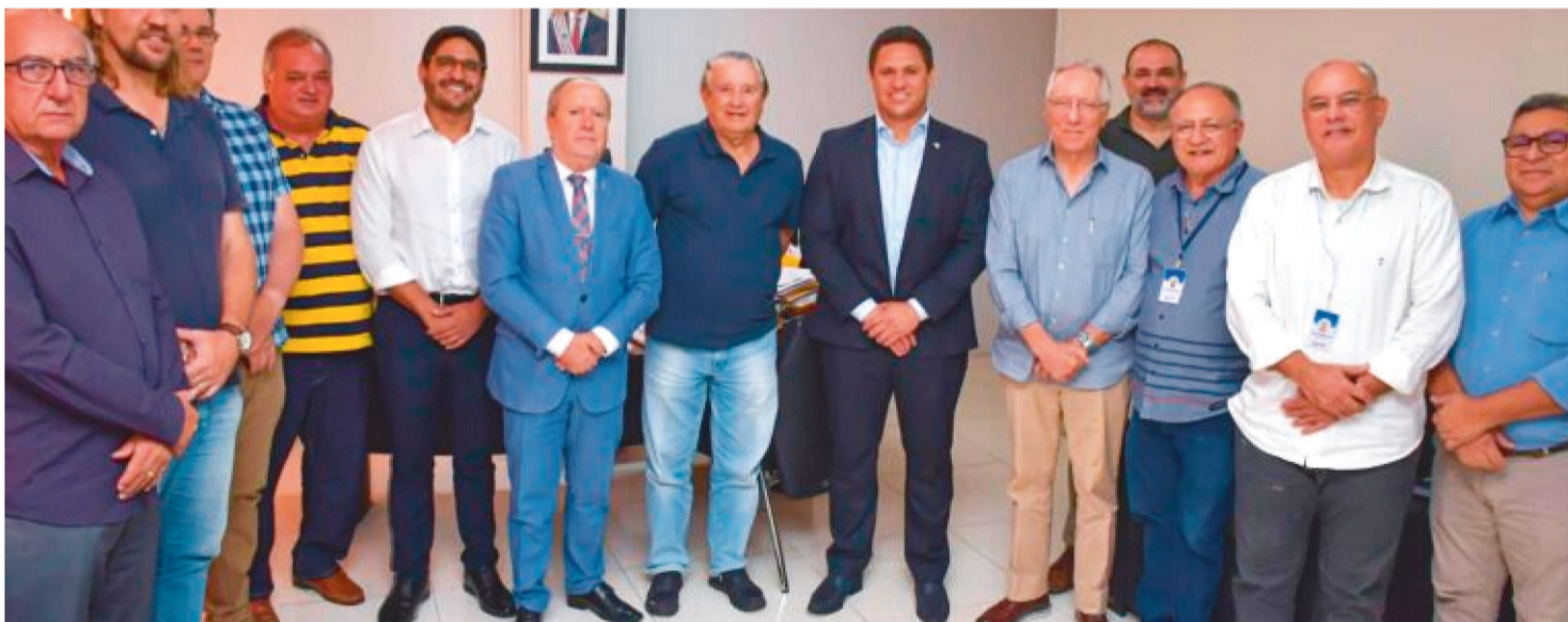
REPRESENTANTES DE VÁRIAS SECRETARIAS ESTADUAIS E OUTRAS AUTORIDADES DEBATERAM CARCINICULTURA NA SEDEPE

O secretário de Desenvolvimento Econômico e Programas Estratégicos, José Reinaldo Tavares, liderou uma reunião, nesta segunda-feira (29), com o intuito de aprofundar as discussões, já realizadas anteriormente, sobre o promissor setor da carcinicultura marinha na zona costeira do estado e buscar soluções eficientes para sua viabilização.