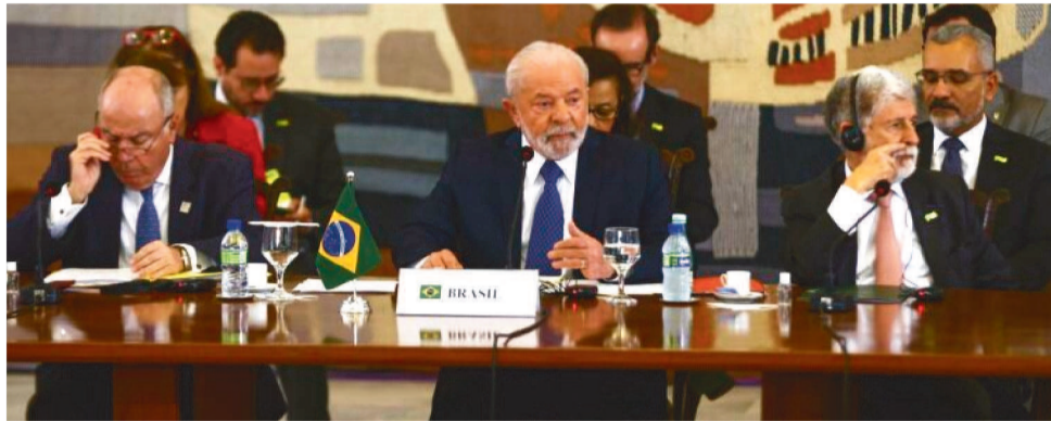
O PRESIDENTE VOLTOU A DEFENDER A INTEGRAÇÃO ECONÔMICA DO SUBCONTINENTE

Lula sugeriu a criação de um foro multilateral regional para fomentar a discussão da integração, e a criação de um grupo de alto nível, com representantes pessoais de cada presidente, que, em 120 dias, deve apresentar propostas a partir das conversas dos